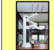
ロボット関連分野等