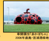
草間彌生「赤かぼちゃ」 2006年 高島・宮浦港緑地