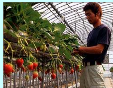
作業姿勢の改善と栽培管理の マニュアル化、自動環境制御

経営の安定化と新規担い手の確保 〈養液栽培普及面積 57.5ha〉 （H22年産、全体の85%）