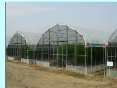
新品種「さぬきのめざめ」の 2うね疎植栽培と妻面の開放

環境の改善による省力化と高品質化 〈さぬきのめざめ栽培面積 24.9ha〉 （H21年度、全体の40%）