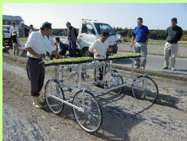
野菜半自動多条移植機「ちどりさん」