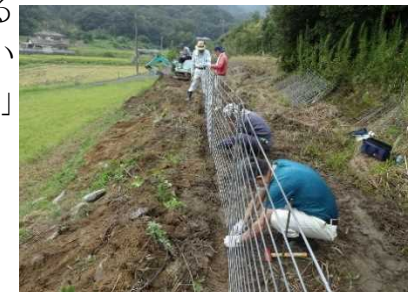
侵入防止柵の改修

今後とも、市町や関係部局等と連携しながら、鳥獣被害対策の基本である3点セットの取組みを推進し、鳥獣に強い集落づくりを進める。