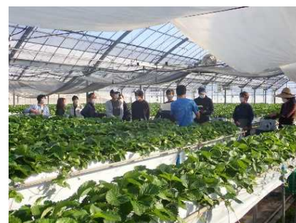
さぬきファーマーズステーション 現地勉強会