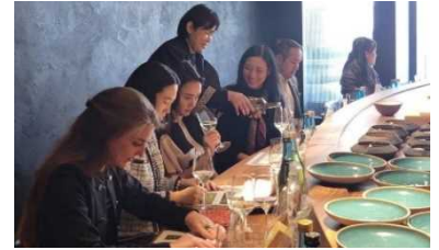
海外での試飲会・商談会を支援

今後も、商品企画力や販売能力の向上等を支援し、農業所得の向上と地域の活性化を促進する。