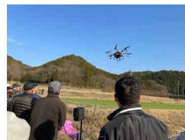
スマート農業技術研修会