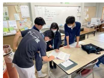
高校生のGAP取得を支援