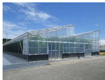
片屋根新型ハウス(NNハウス)