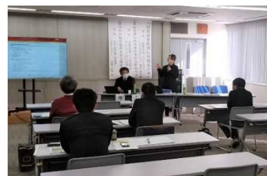
人材育成研修会の開催

「かがわ農山漁村発イノベーションサポートセンター」を通じた推進体制の強化を図り、6次産業化に取り組む農林漁業者等（8者）が抱える課題解決のためにアドバイザーを派遣するとともに、衛生管理や新商品開発、販売促進に関する研修会（3回）を開催した。また、地域の農林漁