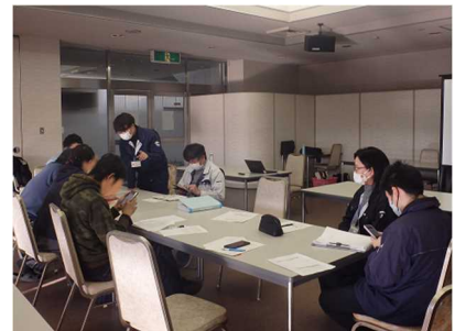
勉強会でのグループワーク

県オリジナル品種等の高品質化や安定生産を図るため、イチゴ「さぬき姫」やアスパラガス「さぬきのめざめ」の栽培管理技術等の実証ほを各地域に設置し、技術指導を実施したほか、生産者等が実施する機械施設等の整備に対して、支援を行った。また、施設資材費が高騰するなか、園芸施設導入に係る初期経費を抑制するため、生産者自らがパイプハウスを施工できる技術を身に付けるために、研修会を開催（受講者 27 人）したほか、ハウス導入マニュアルをホームページに掲載している。さらに、イチゴやミニトマトの収益性の向上のため、ICT 技術を活用して栽培環境データを蓄積し、これに基づく栽培管理のできる生産者を育成するための勉強会を定期的で開催し、蓄積データからミニトマト栽培の環境制御マニュアルを作成して活用している。