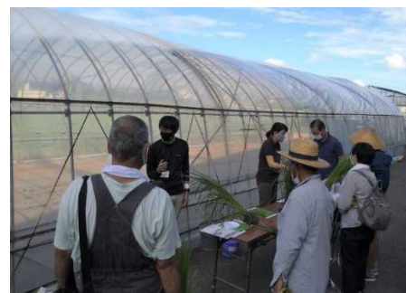
ドローンによる省力防除作業

「おいでまい」をはじめとする水稻は、各地域に実証ほを設置し、技術改善のための現地実証(9箇所)を行うとともに、現地における講習会・研修会等の実施等により、県産米の収量・品質の向上に向けた栽培管理の支援を行った。また、国補事業の活用による