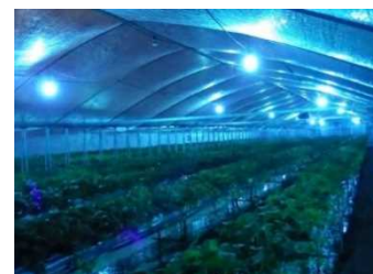
紫外光 (UV-B) 照射によるイチゴの病害抑制

今後も、国の事業を活用し、「環境負荷低減」と「生産性向上」の両立を目指したグリーンな栽培体系の実証と、需要拡大に向けた取組みを展開し、環境にやさしい農業の普及・拡大を図る。