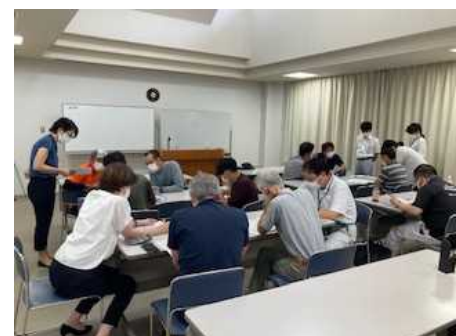
経営発展セミナーの実施