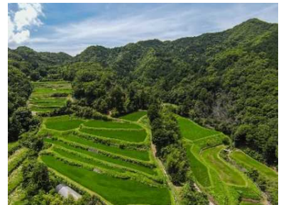
森行の棚田（さぬき市）

今後も、交流人口の増加を図るとともに、農泊等のきっかけを通じて幅広い人々に農村地域への関心や関わりを持ってもらい、地域活動等への参画につなげる。