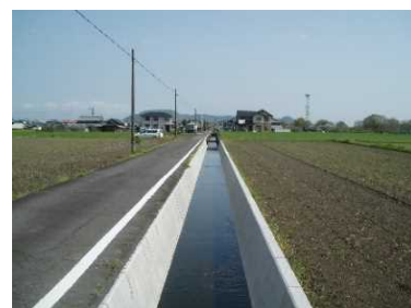
整備後の基幹水路