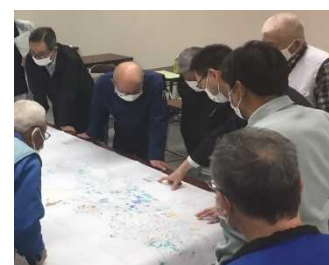
「人・農地プラン」の実質化に係る地域での話し合い

今後も、「地域計画」策定に向けた地域での話し合いや農地の保全管理を支援するほか、兼業農家等を含めた多様な担い手への農地の集積・集約化を促進するとともに、集落営農の育成や簡易な基盤整備等への支援により、優良農地の確保・維持を図る。