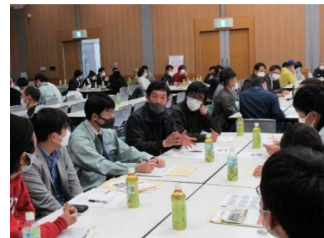
新規就農者と先進農業者との交流

今後も、農業士や関係機関・団体と連携して先進的な農業経営者等との交流を促し、就農から定着までの一貫したサポート体制の強化を図るほか、兼業農家や定年帰農者を含めた多様な担い手の農地集積を支援する。