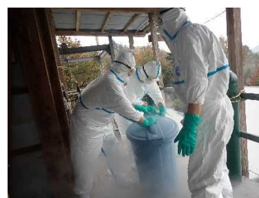
訓練に基づいた適切なまん延防止措置

令和4年11月以降に発生した鳥インフルエンザの対応では、令和3年9月に改正した香川県鳥インフルエンザ防疫マニュアルに基づき防疫措置を行った。また、全養鶏農場に対して消毒用の消石灰を3回配布し、鳥インフルエンザのまん延防止に努めた。