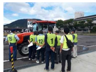
大型トラクターの運転技能研修

JA 香川県や香川県農機具商工業協同組合などで構成する「香川県農作業安全推進協議会」と連携し、大型トラクターの運転技能の向上研修を実施するとともに、農業大学校において、新たに初心者向けの農業機械安全講習を実施