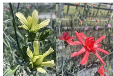
ミニティアラエメラルド(左)、 ミニティアラスピネル(右)