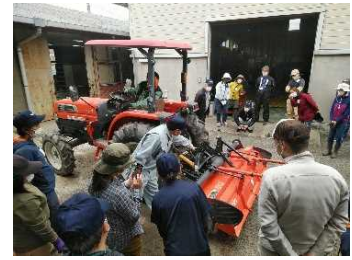
初心者向け農業機械 安全講習

今後も、セーフティネット対策を積極的に推進していくため、収入保険制度等の推進、農作業安全に関する啓発活動や研修会等の開催、気象災害対策情報のタイムリーな発信などを行う。