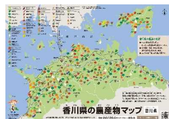
香川県の農産物マップ