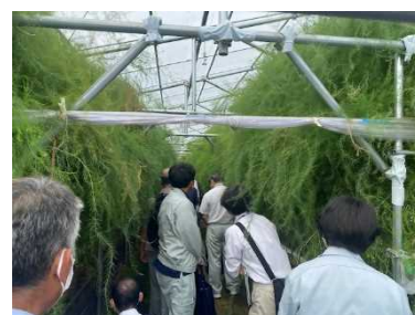
技術見学会(農業試験場)