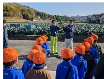
出前授業の実施による 県産農産物の理解促進

今後も、全国に誇れる県産農林水産物の魅力を効果的に発信するとともに、県民の方々が手にしやすい環境づくりを進めて、地産地消をより一層推進する。