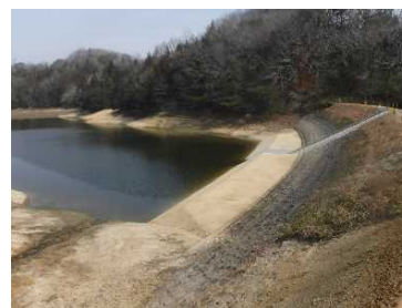
耐震対策後のため池