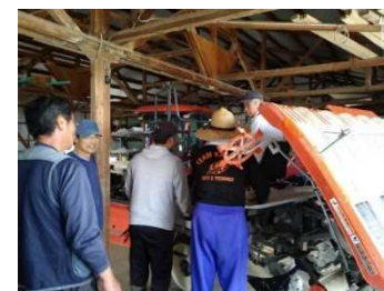
集落営農の後継者育成