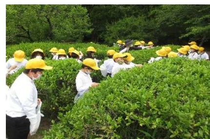
小学生による茶摘体験

今後も、茶の需要促進に向けた茶育事業を継続するとともに、産地の維持・活性化を図っていくため、産地との連携のもと、新商品開発やボランティア等による労働力補完の検討を進め、持続性のある茶生産を支援する。