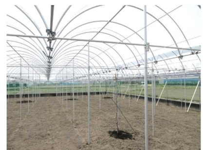
ぶどうの雨除け施設の整備

果樹の生産基盤の強化やブランド化の推進等を柱とした「香川県果樹農業振興計画（目標年度：令和 12 年度）」に基づき、「小原紅早生」や「さぬきゴールド」等の県オリジナル品種を中心に、「シャインマスカット」、「不知火」等の「さぬき讚フルーツ」対象品目の新植・改植、未収益期間の支援や、果樹棚、栽培温室等の導