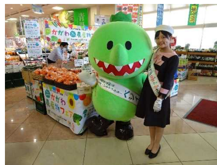
かがわ「旬のイチオシ！」農産物フェア

高品質な県産青果物である「さぬき讚フルーツ」「さぬき讚ベジタブル」「さぬき讚フラワー」を束ねた「さぬき讚シリーズ」や、県オリジナル米「おいでまい」について、県内量販店で『かがわ「旬のイチオシ！」農産物フェア』を28回開催するとともに、SNS等を利用してタイムリーな情報発信を行い、消費者の認知度向上及び県産農産物のブランド化を推進した。また、