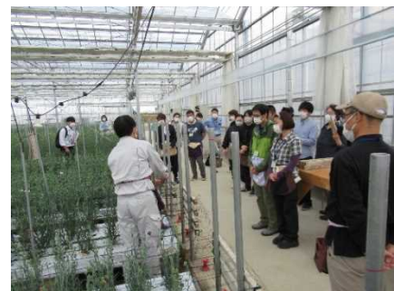
移住就農ツアーの開催

本県農業の魅力や県の支援策など必要な情報を提供、PRするとともに、県外での就農フェアへの積極的な出展（4回）やオンライン就農相談などきめ細かな相談対応と、移住就農ツアー（10月、11人参加）やお試し就農等での先進的な農業経営体との交