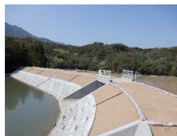
老朽対策後のため池

今後、劣化状況評価の結果を反映した「老朽ため池の整備促進計画第12次5か年計画（R5～R9）」に基づき、老朽度の高い防災重点農業用ため池について、集中的かつ計画的に防災対策を進める。