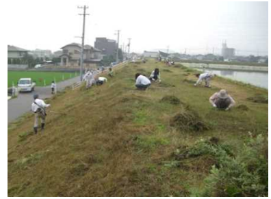
協働で行うため池の保全活動

今後も、本制度への取組面積拡大と既存組織の広域化等による組織の維持・強化を図るとともに、多面的機能の維持・発揮に加え、流域治水の一環としての田んぼダムの取組みも併せて推進する。