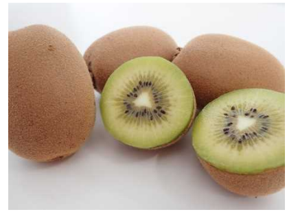
品種登録出願中の 「さぬきエメラルド」

今後も、多様な担い手による特色ある果樹産地を形成していくため、「さぬき讚フルーツ」対象品目を中心に生産拡大とブランド果実の安定生産を一層推進する。