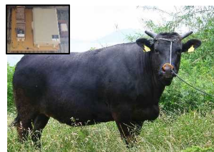
行動モニタリングセンサーを装着した繁殖雌牛

今後も、オリーブ畜産物の生産基盤の強化を図り、高品質な畜産物の安定的な生産を促進する。