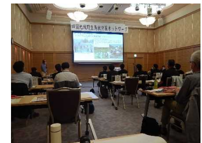
四国地域野生鳥獣対策ネットワークの研修会