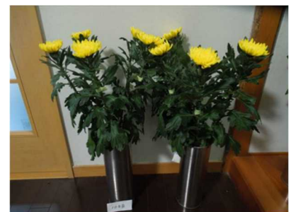
ホームユース向けの 有色菊

今後も、花き生産者の経営安定を図るため、県オリジナル品種を中心に技術支援を実施するとともに、国・県の補助事業を活用し、機械・施設の導入を支援する。