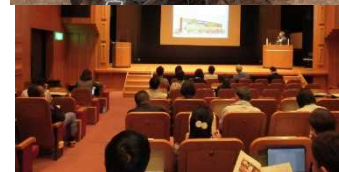
かがわの「環境にやさしい農業」推進セミナー