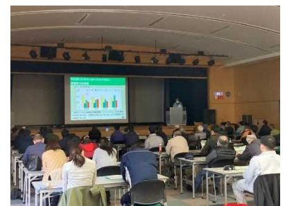
新品種普及促進研修会