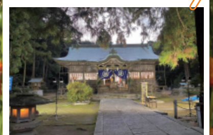
東かがわ市水主地区

中山間・棚田地域において住民活動が行う棚田地域等の保全活動や地域住民活動の活性化に要する経費を支援しています。令和5年度は5地区を支援しました。