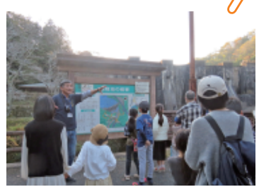
【ふるさと探検隊】豊稔池

都市部の小学生が、ため池や用水路等の土地改良施設の重要性を学習し理解を深めるため、県内の土地改良施設を巡る活動を実施しています。