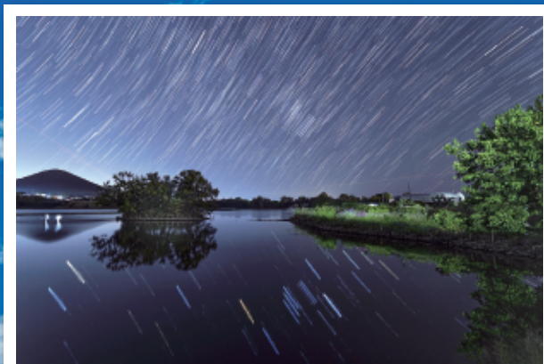
第22回 最優秀賞【恵水は星を湛える】