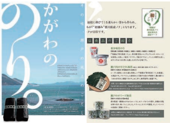
かがわのり リーフレット