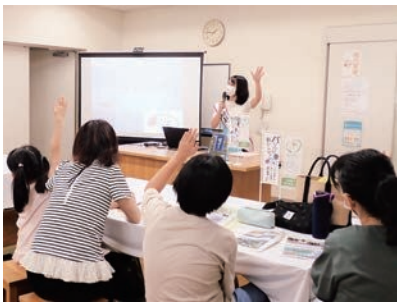
まなびCAN水産体験教室 8/5

県内の小中学校等で実施された家庭科の宿題等で使用する食材として、県内5校に焼海苔（全型）4,600枚、味付ノリ（8切り5枚）1,270袋、焼ノリ（8切り5枚）1,270袋を提供した。