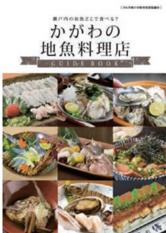
かがわの地魚料理店 GUIDE BOOK (改訂版)