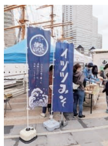
「さかな文化祭」で伊吹いりこ出汁の味噌汁を無償提供 3/19