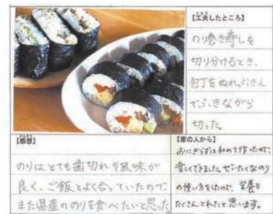
小中学校等へのノリ提供