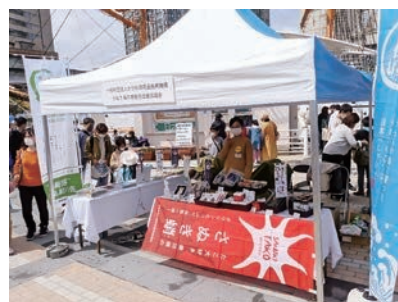
「さかな文化祭」で香川県産水産物をPR 3/19