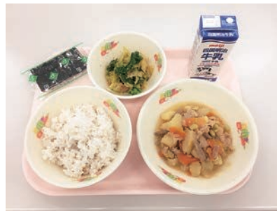
学校給食への“初摘み”香川県産ノリの提供