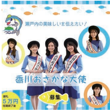
香川おさかな大使募集 SNS広告