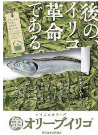
オリーブイリコポスター