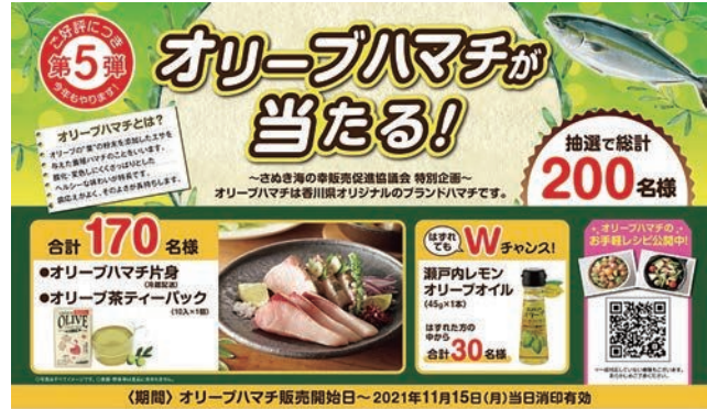
オリーブハマチが当たる！プレゼントキャンペーン