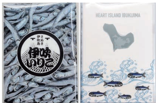
伊吹いりこミニクリアファイル