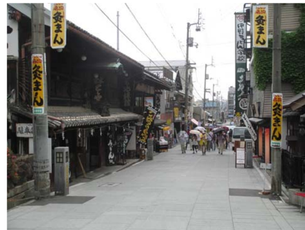
【琴平町 表参道 現状】