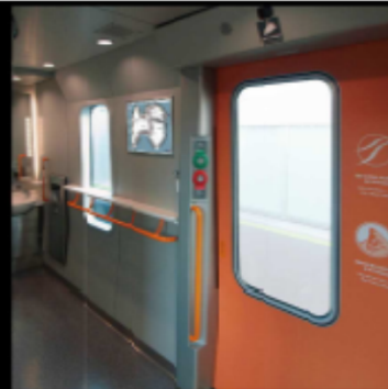
ユーティリティスペース Utility Space