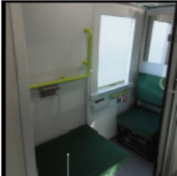
多目的室 Multi-Purpose Room 座席として利用することも可能で多彩な利用が可能