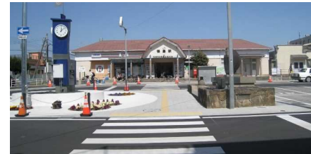
鴨島駅ロータリー整備