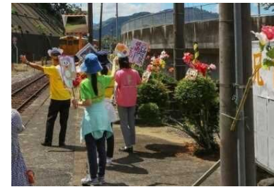
7/26 沿線地域招待列車