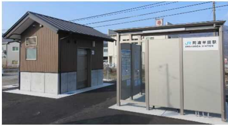
阿波半田駅公衆トイレ(左)