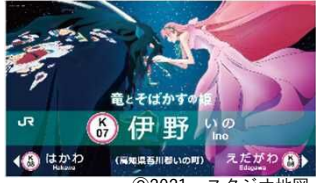
駅名標特別ラッピングデザイン

「竜とそばかすの姫」に伊野駅や列車が登場 伊野駅駅舎の一部や1番線駅名標を映画をモチーフ に特別ラッピング 8/7～2022/3/27