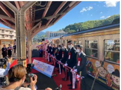
沿線首長等によるテープカット