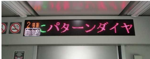
パターンダイヤのPR (特急列車車内)