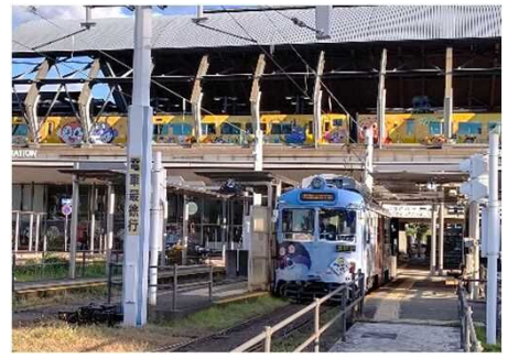
「アンパンマンミュージアムPR路面電車」(水色の車両)とアンパンマン列車(黄色の車両)