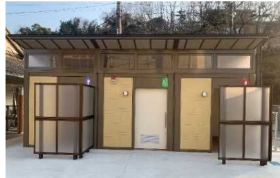
穴吹駅公衆トイレ