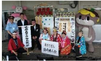
須崎駅19分劇場看板除幕式