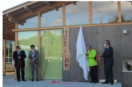
集落活動センターあわ