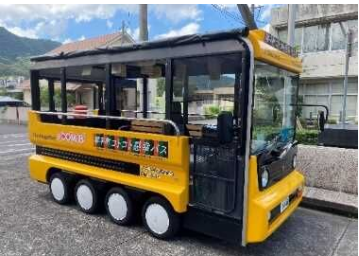
さぬき市「コミュニティバス」 東かがわ市「グリーンスローモビリティわくわく号」 琴平町「コトコト感幸バス」