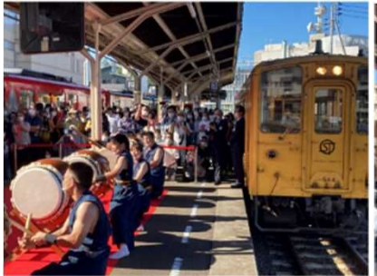
鬼北町有志による太鼓演舞

・10/9、10「Yodosen Fun Fun Trains」等のラッピング列車を集結させ予土線沿線を盛り上げるイベントを開催 ・イベント来場者 宇和島駅 約1,800名