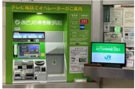
みどりの券売機プラス