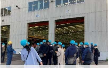
愛媛県内運輸業職場紹介

・11/13 運輸業界の現場を見学し若年求職者の理解を深めてもらうツアーを松山車両基地や旅客船ターミナル等で開催 ・愛媛県の公共交通人材確保緊急対策事業の一環、高校生や大学生等16名参加