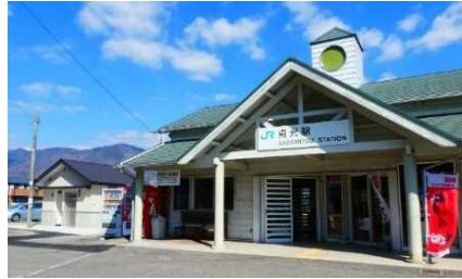
貞光駅公衆トイレ(左)