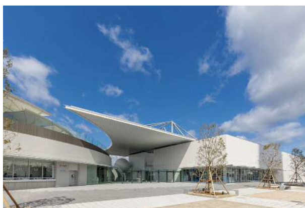
▲2020年にオープンした四国水族館