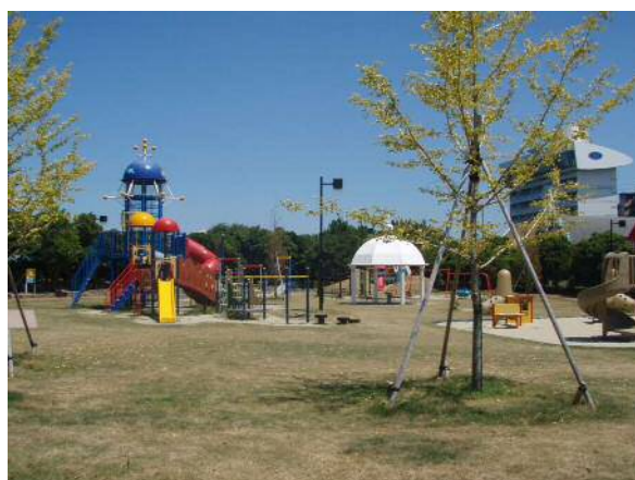
▲広々とした遊具広場