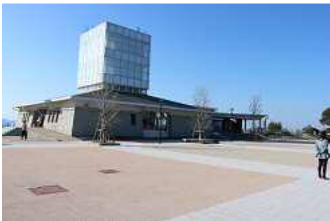
▲うたづ海ホテル。夜間はライトアップされます。