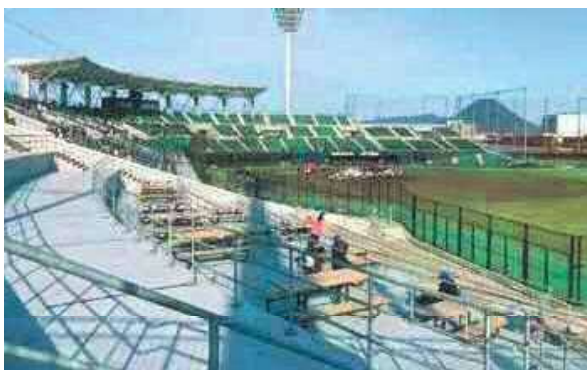
▲児童からプロ野球まで幅広く利用されるレクザムボールパーク丸亀(丸亀市民球場)