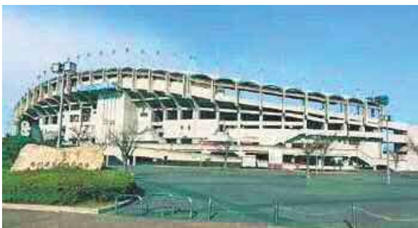
▲プロからアマチュアまでの競技が行われるPikaraスタジアム(県立丸亀競技場)