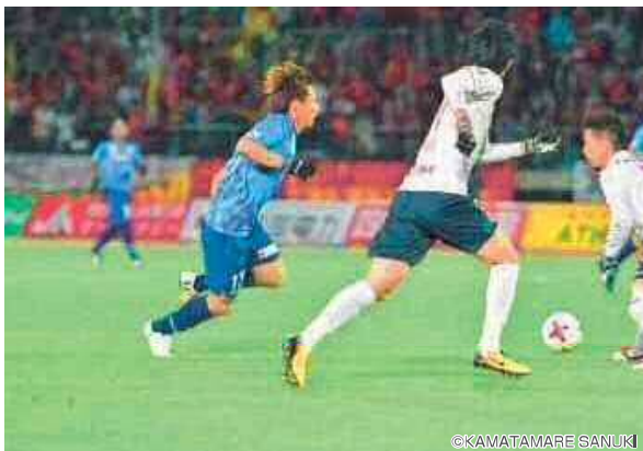
▲カマタマーレ讃岐のホームスタジアムとして交流人口の拡大に寄与