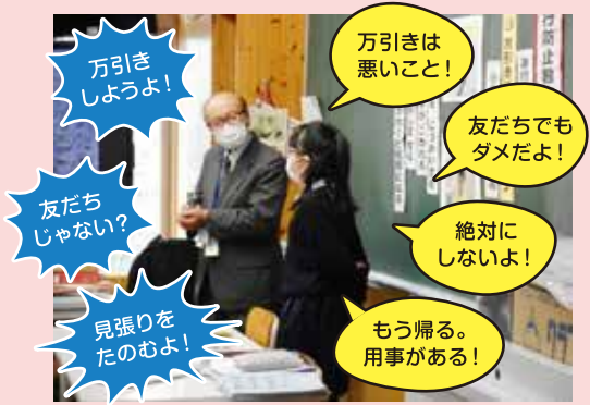
「万引きをさそわれた場面のロールプレイ」

【保護者の皆さまへ】 非行防止教室を小4、小6、中学生と継続的に実施する中で、小・中学生の万引きは減少傾向にあります。 「絶対に万引きをしない」「非行にかかわらない」という強い意志を育てるために、保護者の皆さまのご協力が欠かせません。お子様を書いた「わたしのちかい」や保護者の皆さまの願いをもとに、お子様と話し合ってくださいと思います。 ※裏面「我が家のルールをチェック」の記入をお願いします。