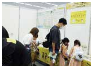
環境学習会（サンメッセ香川）