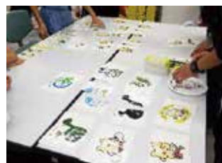
ゲームを通じた認定マークのPR