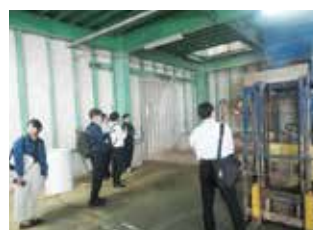
視察（循環型社会構築四国連携協議会）