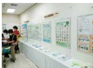
愛媛 3R フェア（愛媛県）