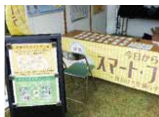
ゲームを通じた認定製品のPR