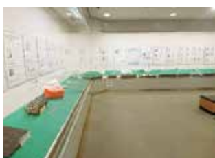
パネル展示（文書館）