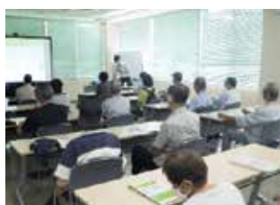
チラシ配布（くらしのセミナー）