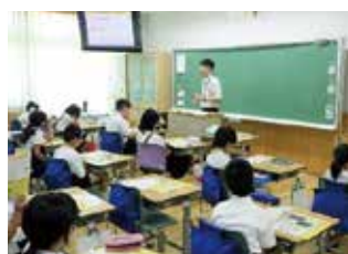
チラシ配布（環境キャラバン隊）