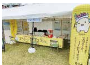
なおしま環境フェスタ（海の駅）