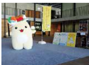
3R 推進講演会（ハイスタッフホール）