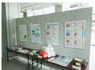
パネル展示（県庁ギャラリー）