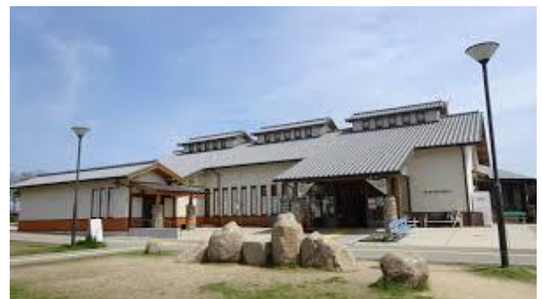
④道の駅 源平の里むれ