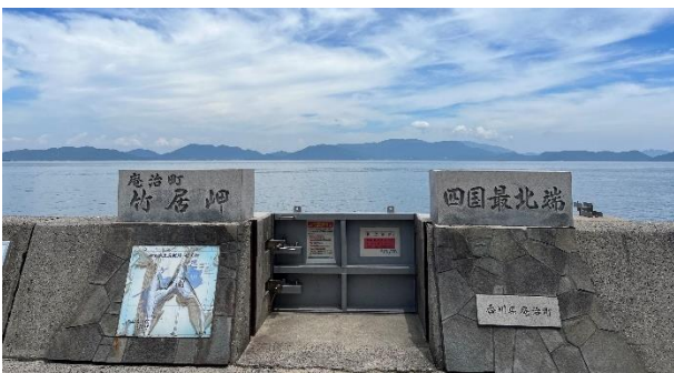
②竹居岬（四国最北端）