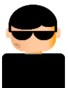
攻撃者 (A社のなりすまし)