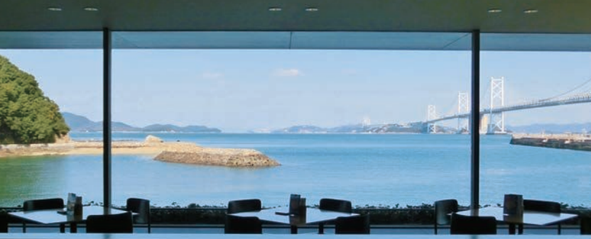
当館ラウンジからの景観