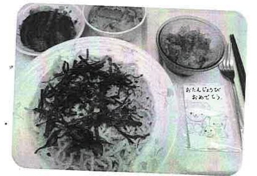
給食のメニューにないものをリクエストされる方も！写真は「ロールキャベツ」(左)と「たらこスパゲティー」(右)。お祝いのカードを添えて♥