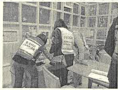
(職員からゴミの管理方法を教わるボランティア)