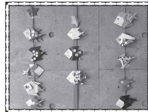
児童課西棟の子どもたちが制作しました!

ぼくは、4月9日高等部に入学しました。分からない友達ばかりでふあんもたくさんありました。入学式は、すごいきんちょうしました。高等部に入学して、はじめて会う友達の横にすわるのは、すごいきんちょうしました。どれもがふあんなことばかりでしんばいなことは、いっぱいありました。はじめて会う先生にも、きんちょうしました。入学式は、すごいきんちょうしました。(S.K.)