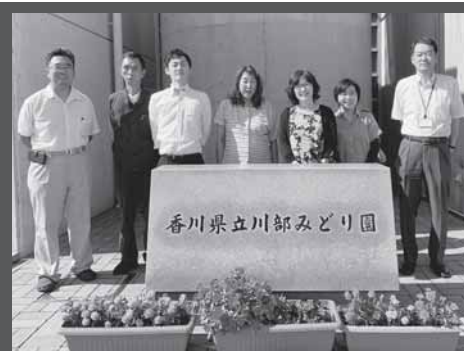
園長・総務課・医務