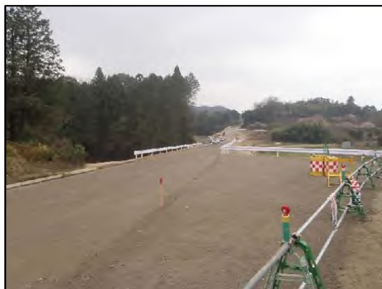
山本工区工事実施状況