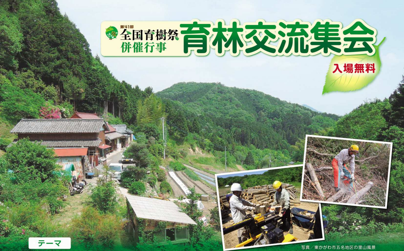
写真 / 東かがわ市五名地区の里山風景