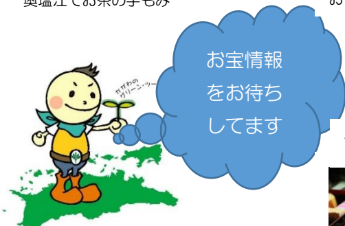
かがわのグリーン・ツーリズムキャラクター