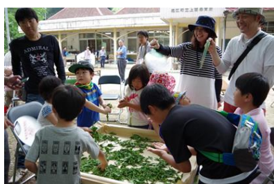
奥塩江でお茶の手もみ

*あなたのまわりの残したい農村風景、伝統行事、技術、風物詩などの情報をお待ちしています。