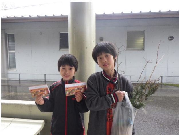
香川県満濃池森林公園

どんぐり銀行から払い戻された苗木が、県内各地で育ち、大きく成長することを願っています。