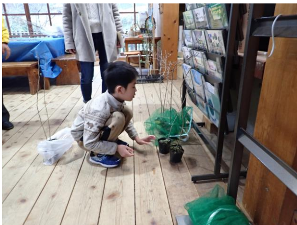
どんぐりランドビジターセンター