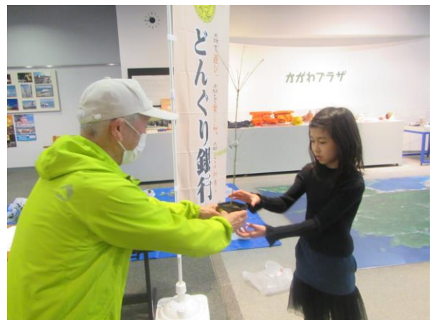
かがわの森 アンテナショップ