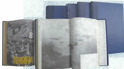
▲月刊香川・広報香川