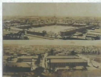
▲丸亀歩兵第十二連隊全景写真