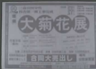
〔三本松高校引田分校大菊花展ちらし〕 昭和57年度 （大川東）