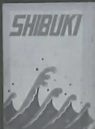
SHIBUKI 創刊号 昭和22年3月15日発行 （多度津水産）