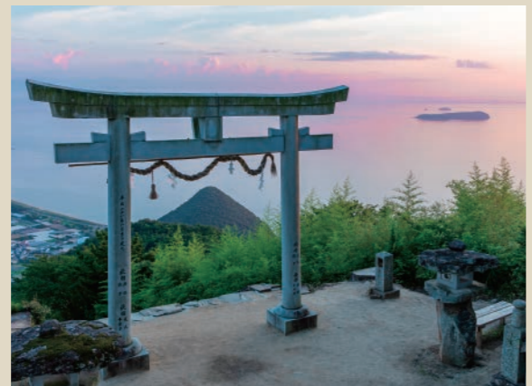
高屋神社本宮の天空の鳥居越しに見える「有明富士」。

高松市郊外の御厩町と国分寺町の境にそびえる。一説には「娘山」と呼ばれていたという伝説もある。「檀紙富士」と呼ばれることも。