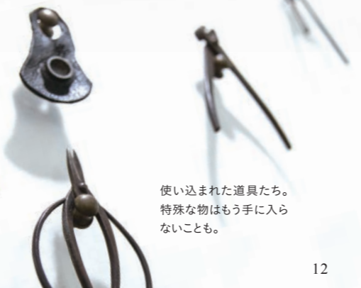
使い込まれた道具たち。 特殊な物はもう手に入ら ないことも。