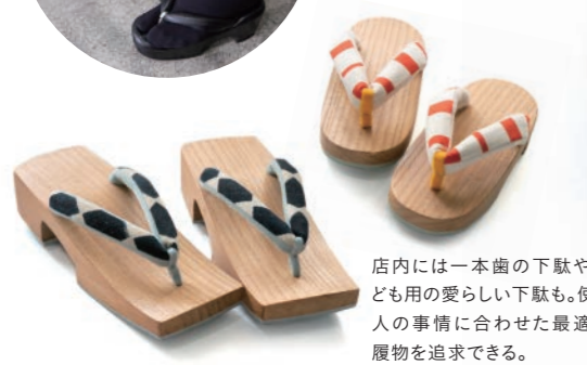
店内には一本歯の下駄や子 ども用の愛らしい下駄も。使う 人の事情に合わせた最適の 履物を追求できる。