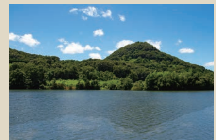
「東讃富士」の周囲にもため池が多く、「里の池めぐりの道」というウォーキングコースもある。

七富士の中で最も西に位置する「江甫草山」は、まるで海に突き出たピラミッド。北にはヨットハーバーや室本港があり、南には夕日が美しい有明浜がある。山頂からは燧灘を一望できる。