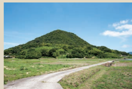
田園風景の中の「高瀬富士」。

一番東にあるのが「東讃富士」。三木町にあるので「三木富士」と呼ぶ人も。登山口には白山神社が鎮座し、祝祭日には山頂に日の丸がはためく。