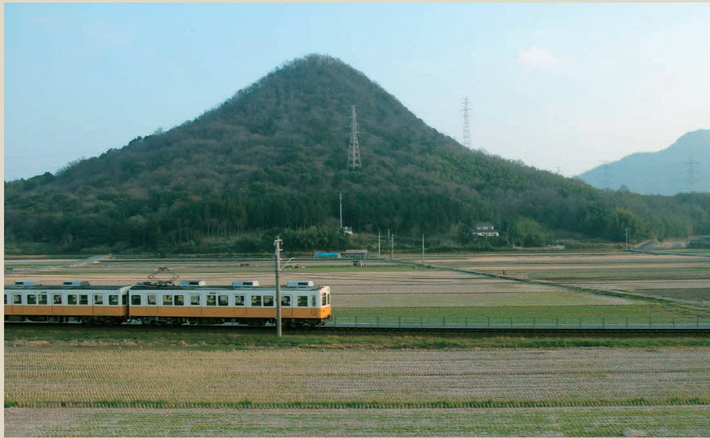
裾野を引いた「羽床富士」と電車とのコラボレーションは、まるでジオラマ写真。