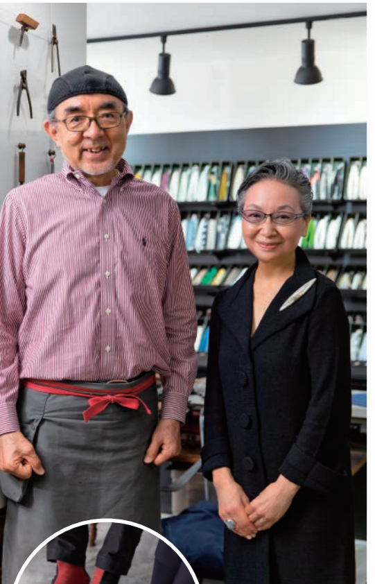
オリジナルブランド「マイソール 下駄」を洋服姿で粋に履きこ なす二人。