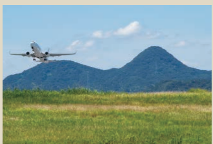
空港周辺からも望むことできる「綾上富士」。

かつて高瀬町の町歌にも歌われた「爺神山」。大師堂やミニ四国霊場があり、採石で削られ標高214mになったのにちなみ、最近では「パレンティン山」とも呼ばれる。