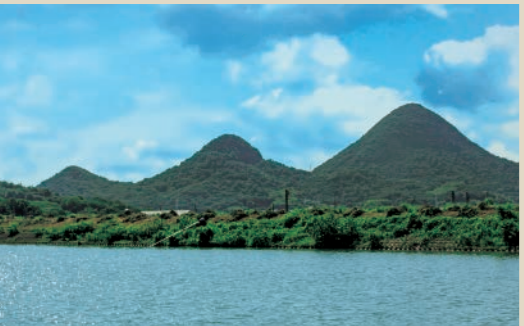
一番高い「六ツ目山」を長男として、伽藍山、狭箱山とおむすび山三兄弟が並ぶ。

どこから見ても美しい山容は、まさにミニチュア富士。ことでん琴平線「羽床駅」の南側に位置し、カラフルな電車やレトロな電車がよく似合う。