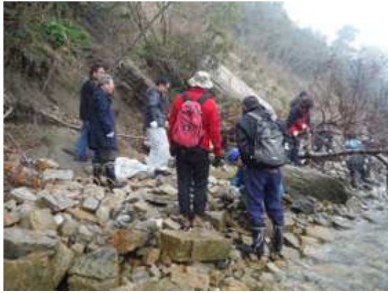
ビーチクリーンアップの様子