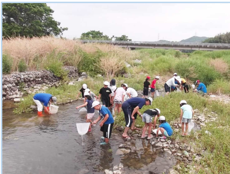
綾川町立羽床小学校 「綾川」