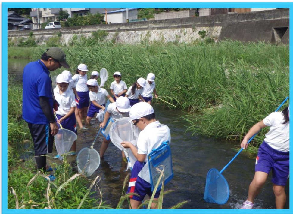
土庄町立湊崎小学校 「伝法川」