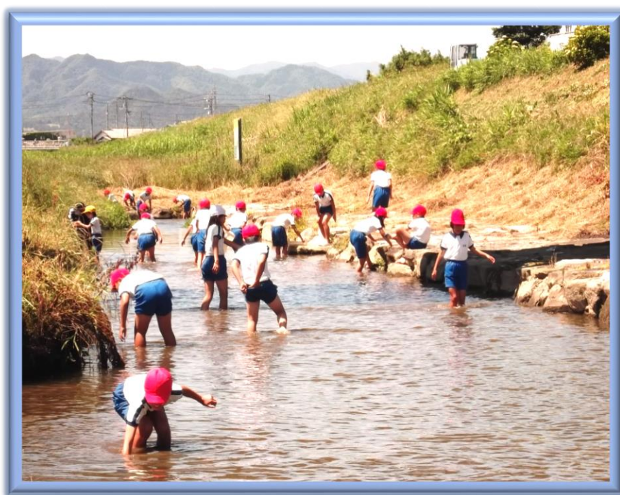
さぬき市立造田小学校「鴨部川」