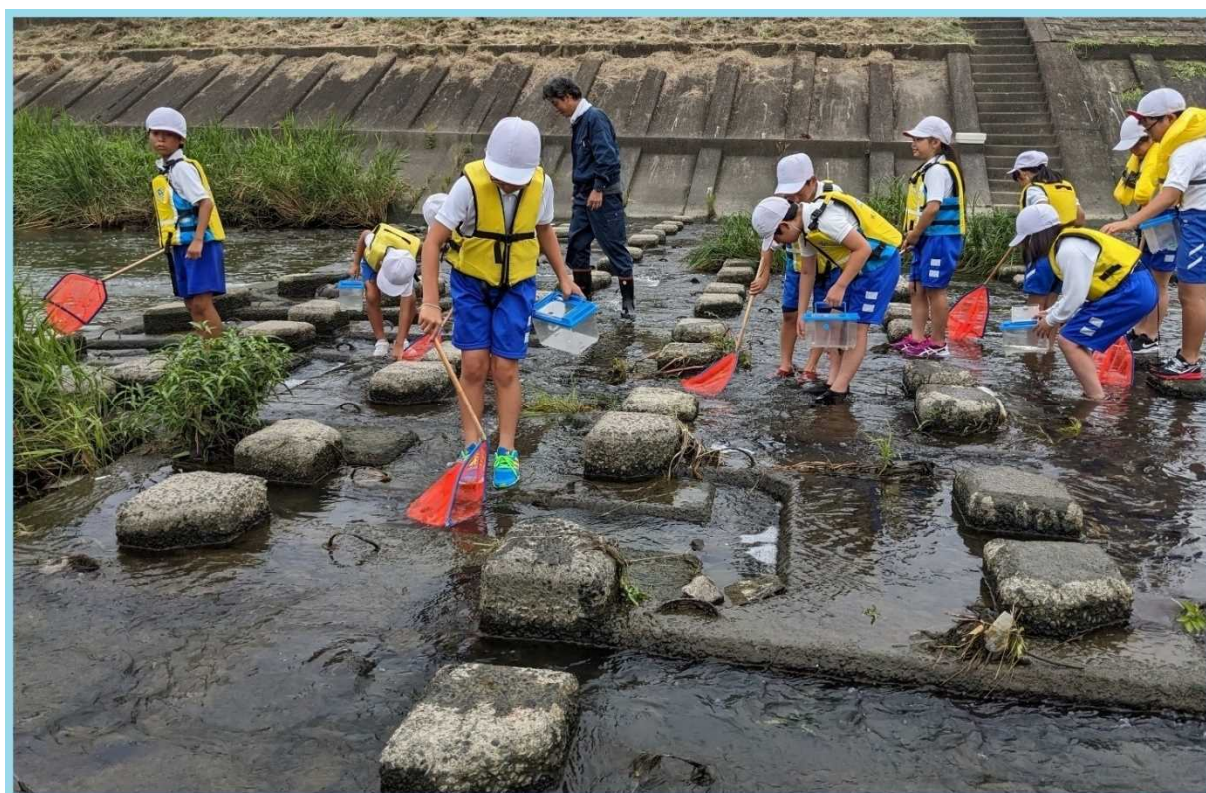
宇多津町立宇多津小学校 「大束川」