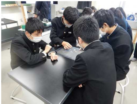
海岸で集められたマイクロプラスチックを分類する様子