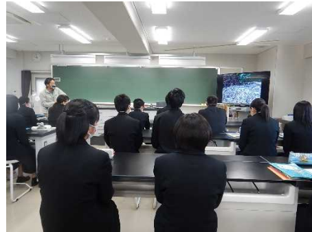
海ごみが生物へ与える影響等を学ぶ様子