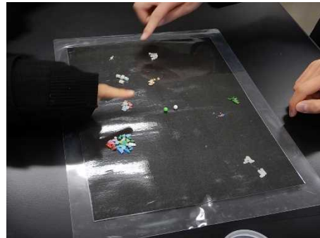
分類されたマイクロプラスチックが何由来かを考察する様子