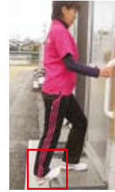
アキレス腱伸ばし