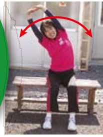
背伸び・体側伸ばし