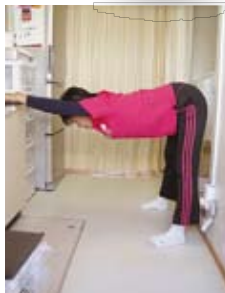
肩と太もも裏のばし