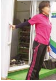
玄関の手すりを使って肩のストレッチ