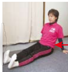
足首の曲げ伸ばし

じっとしていると足腰の血行が悪くなり、疲労や腰痛、むくみや冷えにつながります。意識して脚の血流改善を積極的に行いましょう!