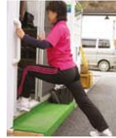
股関節とふくらはぎ