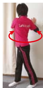
上体ひねり(左右・斜め上)