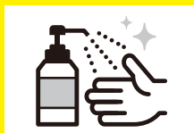
手指消毒液の設置