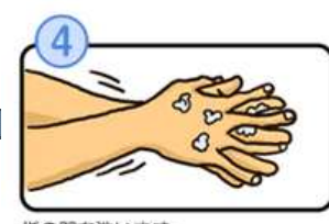
指の間を洗います。