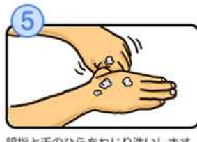
親指と手のひらをねじり洗います。