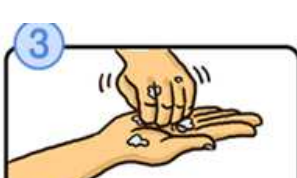
指先・爪の間を念入りにこすります。