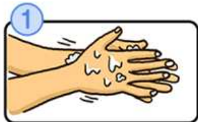
流水でよく手をぬらした後、石けんをつけ、手のひらをよくこすります。