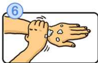
手首も忘れずに洗います。