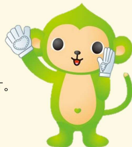
香川県ゲートキーパー推進キャラクター 「キーもん」

香川県こども・若者の自殺危機対応チーム事業は、 学校や市町などの地域支援者を支えるための事業です。