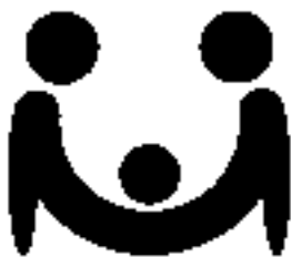
“子育て・介護” 応援企業認証マーク

働きやすい環境づくりに積極的に取り組んでいる企業に交付しています。マークを取得して、優れた人材の確保や企業のイメージアップに役立てましょう。