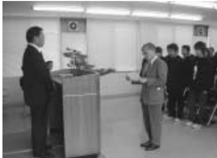
丸亀高等技術学校入校式 (H15.4.8)

丸亀高等技術学校では、溶接技術科、金属技術科など、5学科で59名が入校しました。