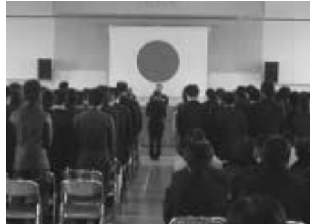
高松高等技術学校入校式 (H15.4.9)

丸亀高等技術学校では、溶接技術科、金属技術科など、5学科で59名が入校しました。