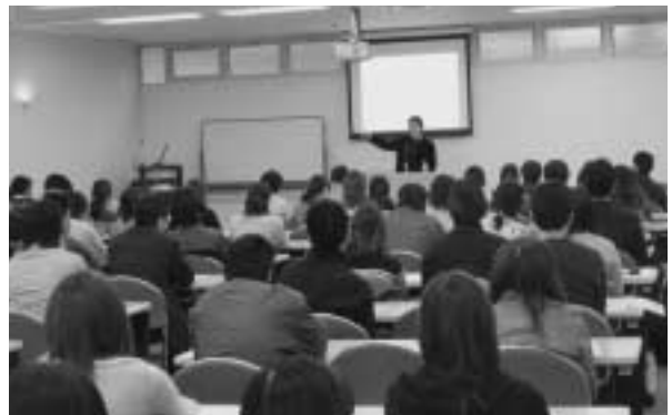
パワーアップ講座の様子

若年者の就職支援対策事業として、しごとプラザ高松など関係機関と連携し、「がんばる若者！パワーアップ大作戦inしごとプラザ高松」を開催しました。プログラムは、「パワーアップ講座」「パワーアップ相談会」「パワーアップ面接会」の3本立てで実施しました。パワーアップ面接会では、トライアル雇用を実施する34の事業所に60名の就職を希望する若年者が、真剣な表情で面接に臨んでいました。