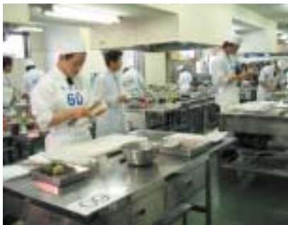
競技風景（日本料理）