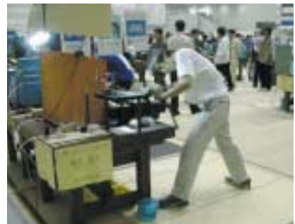
競技風景（機械組立て）