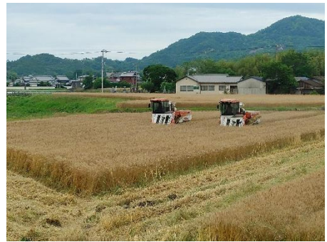
集落営農組織活動