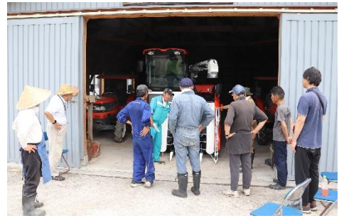
農業機械の操作研修会