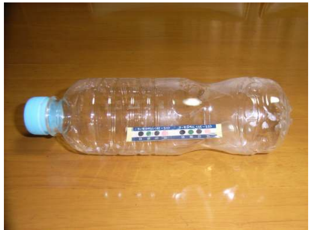
写真3 使用後のペットボトル (膨満するが、破裂はしない)