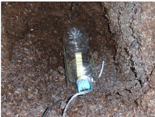
写真2 簡易温度計の埋設状況 (表面から30cm以上)