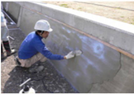
水路の補修・更新