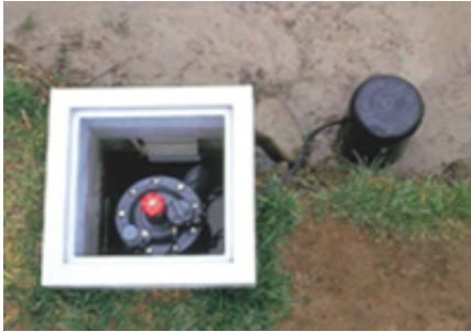
自動給水栓の設置