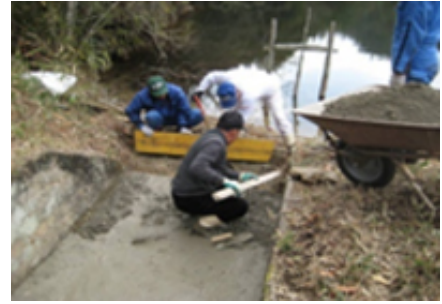
洪水吐(ため池)の補修