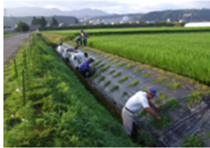
カバープランツの設置