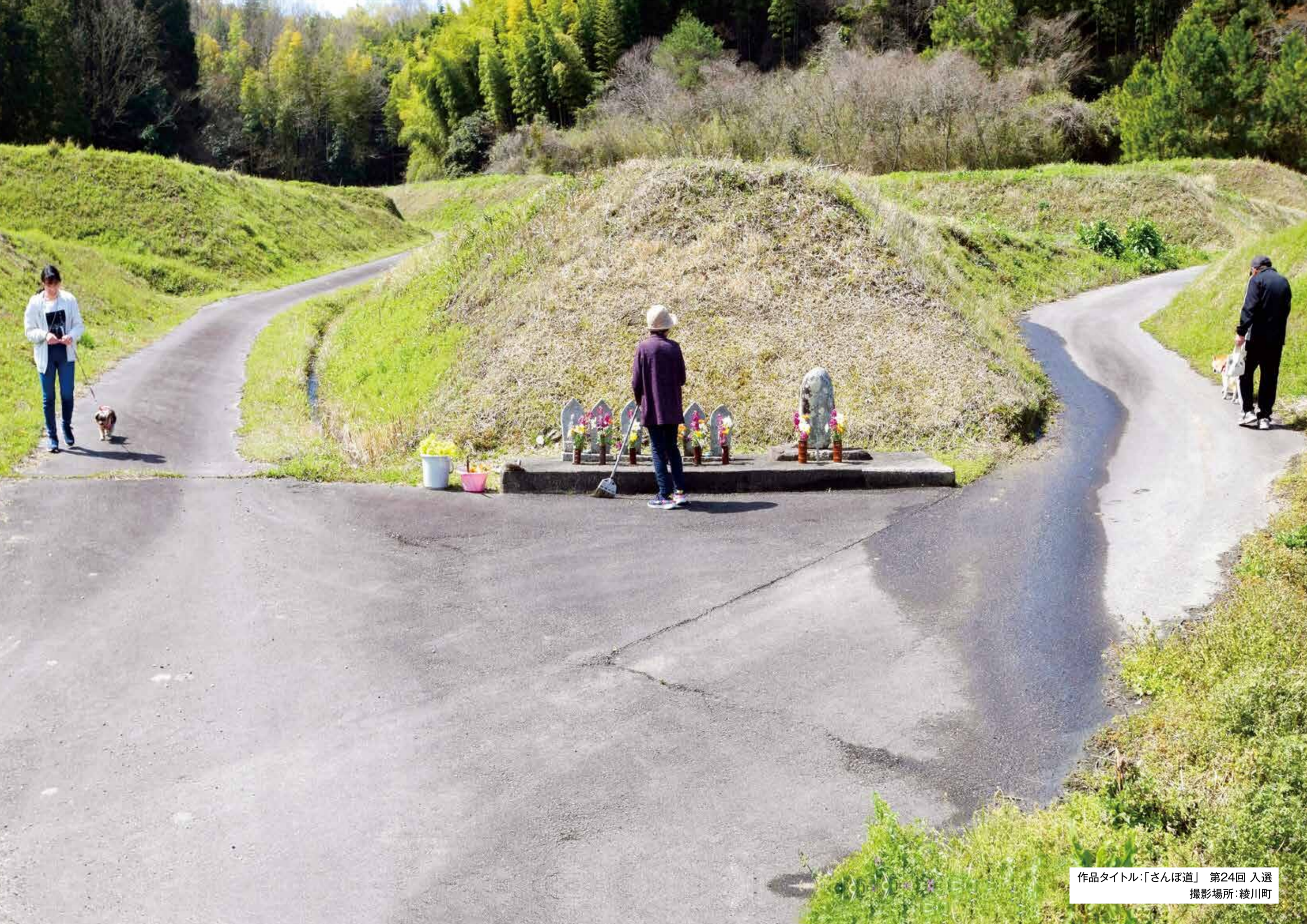
作品タイトル:「さんぼ道」 第24回 入選 撮影場所:綾川町