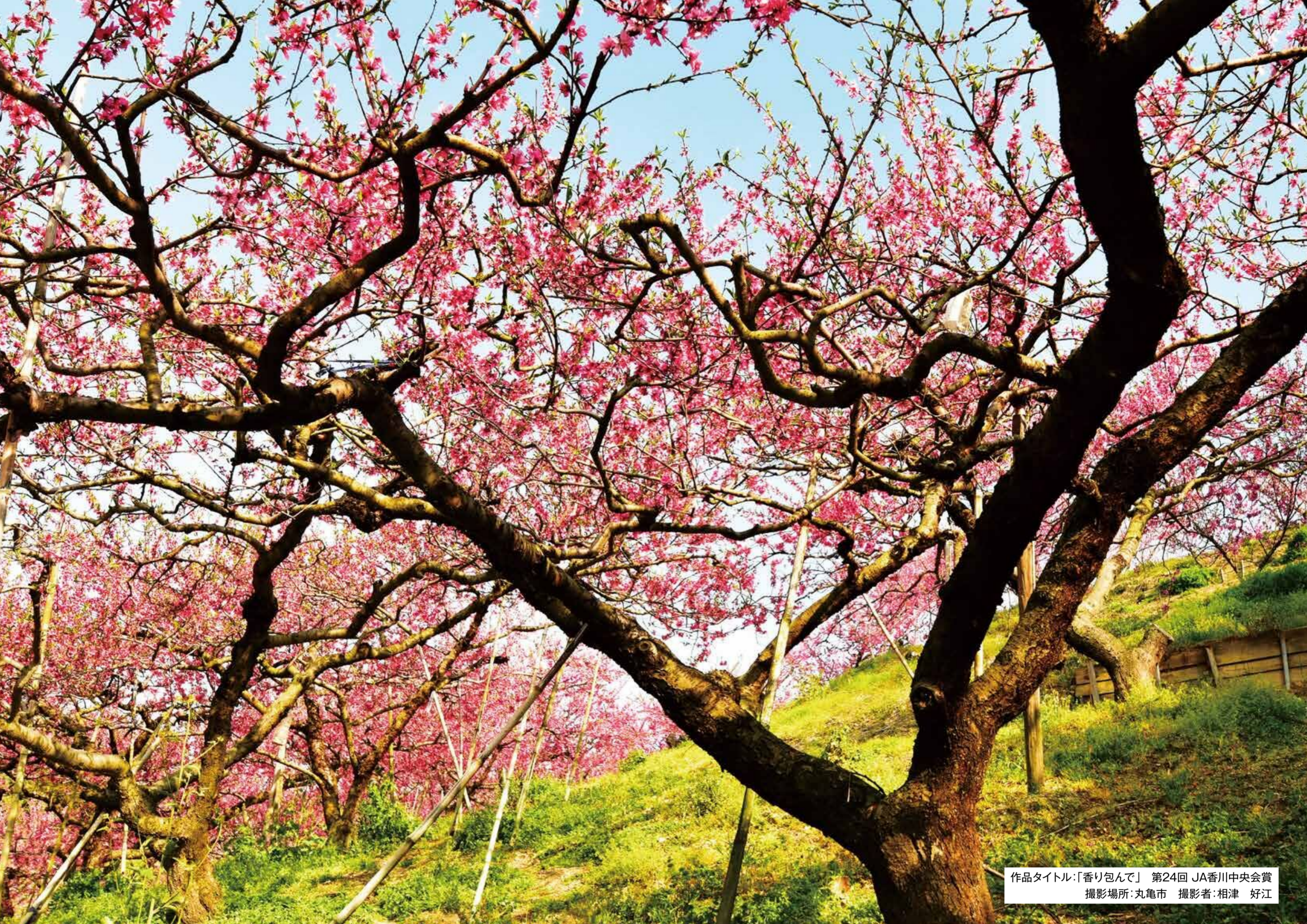
作品タイトル:「香り包んで」 第24回 JA香川中央会賞 撮影場所:丸亀市