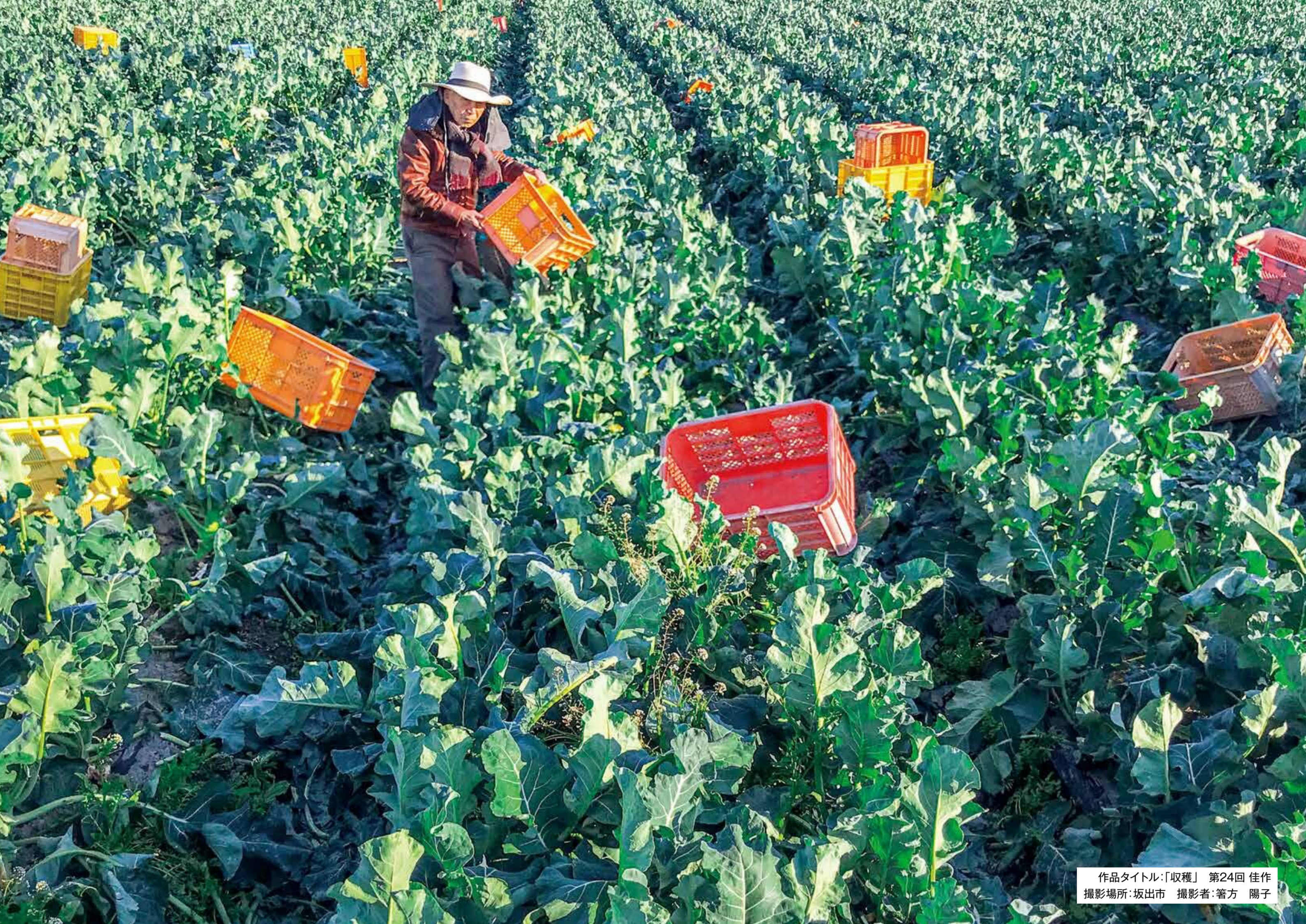
作品タイトル:「収穫」 第24回 佳作 撮影場所:坂出市