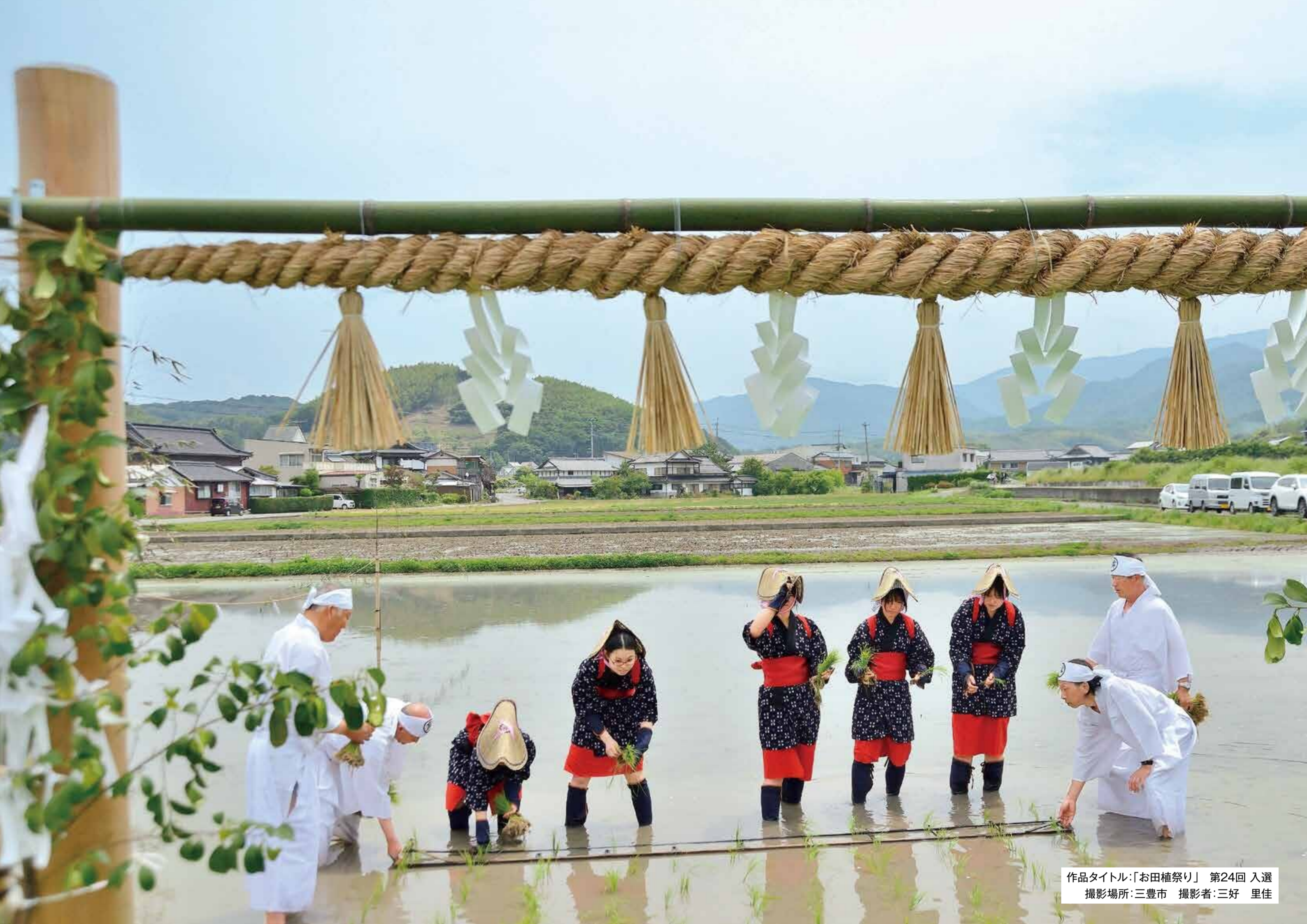
作品タイトル:「お田植祭り」 第24回 入選 撮影場所:三豊市