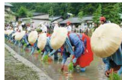
主基斎田お田植まつり (綾川町山田上) 6月中旬日曜日 大正4年の主基斎田に当時の山田村の田が選ばれたことを記念して行われる。