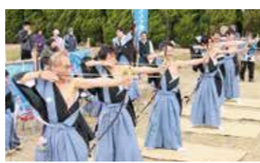
(県指定無形民俗文化財)