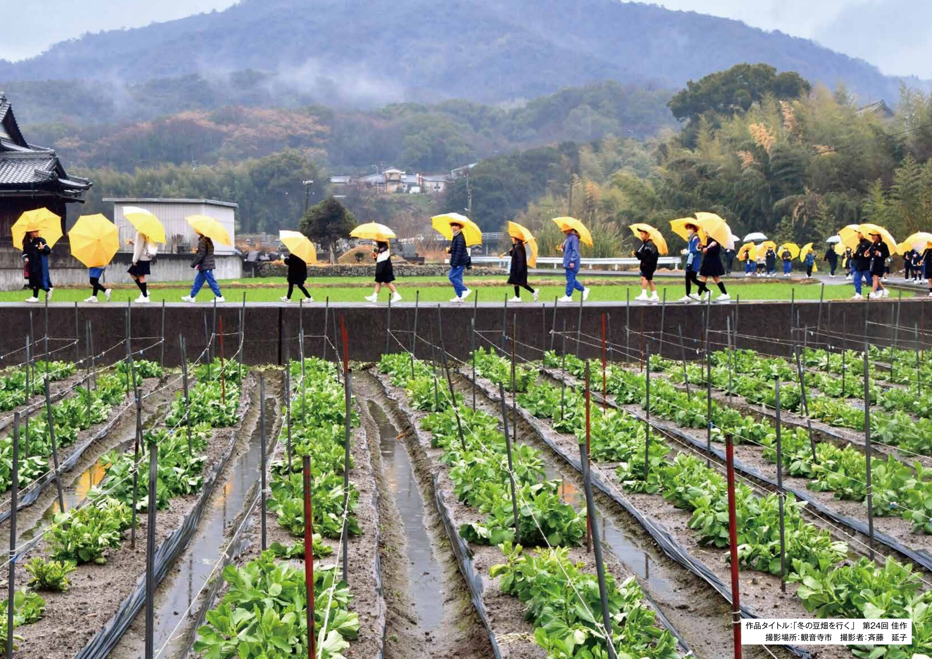
作品タイトル:「冬の豆畑を歩く」 第24回 佳作 撮影場所: 観音寺市