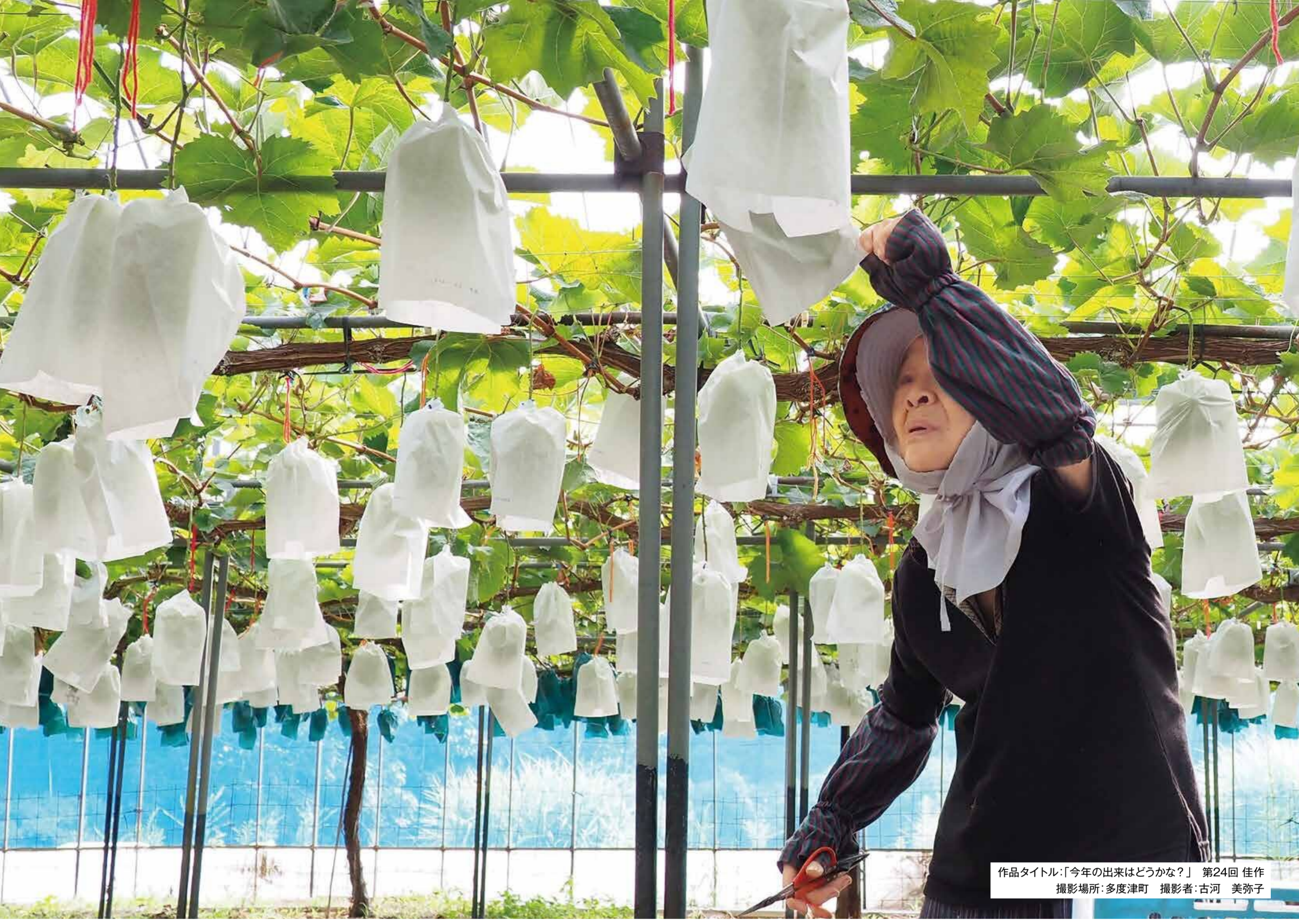
作品タイトル:「今年の出来はどうか？」 第24回 佳作 撮影場所:多度津町