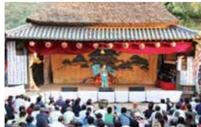
中山農村歌舞伎 (小豆島町中山) 10月中旬