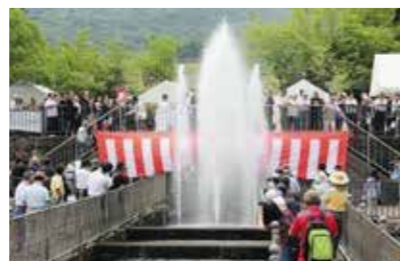
香川用水水口祭 (三豊市財田町) 6月11日