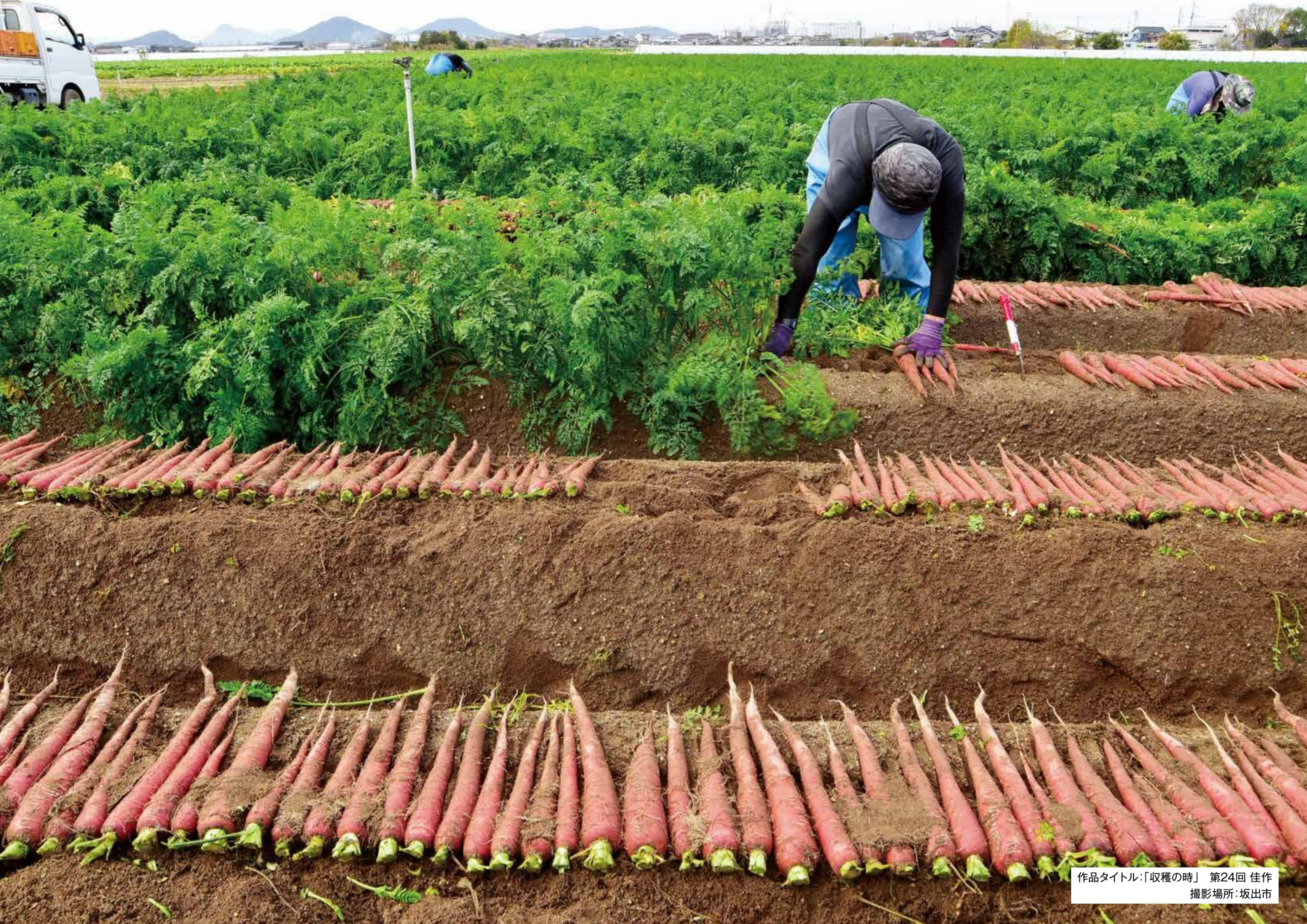
作品タイトル:「収穫の時」 第24回 佳作 撮影場所:坂出市