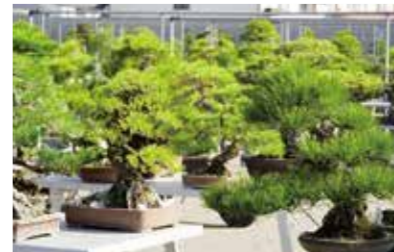
高松盆栽の郷フェスタ2026 (高松市国分寺町) 10月24日・25日 松盆栽の生産日本一の高松で開催される毎年恒例のイベント。気軽に盆栽を楽しめる内容で人気です。