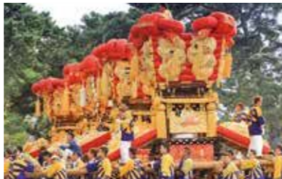
さぬき豊浜ちょうさ祭 (観音寺市豊浜町) 10月第2日曜日を最終日とする金土日の3日間