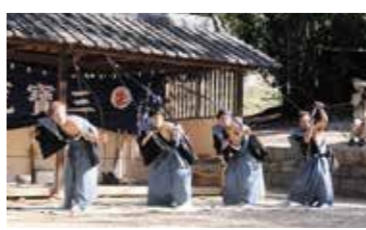
(国の重要無形民俗文化財)