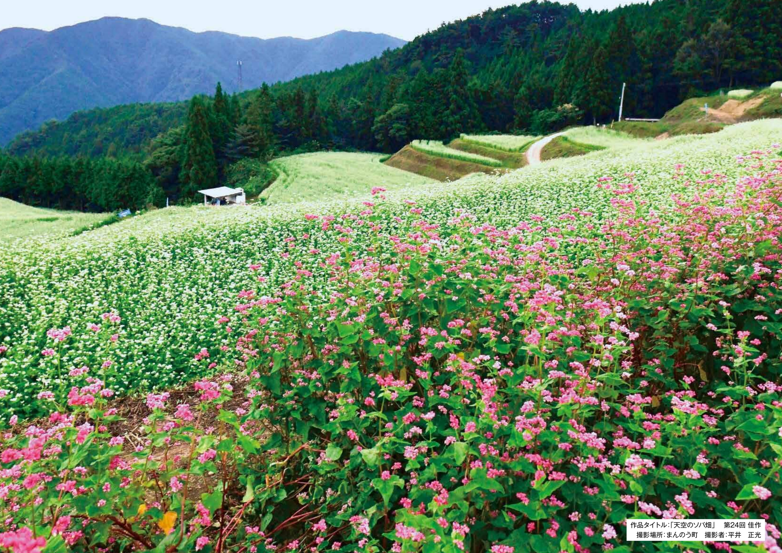
作品タイトル:「天空のソバ畑」 第24回 佳作 撮影場所:まんのう町