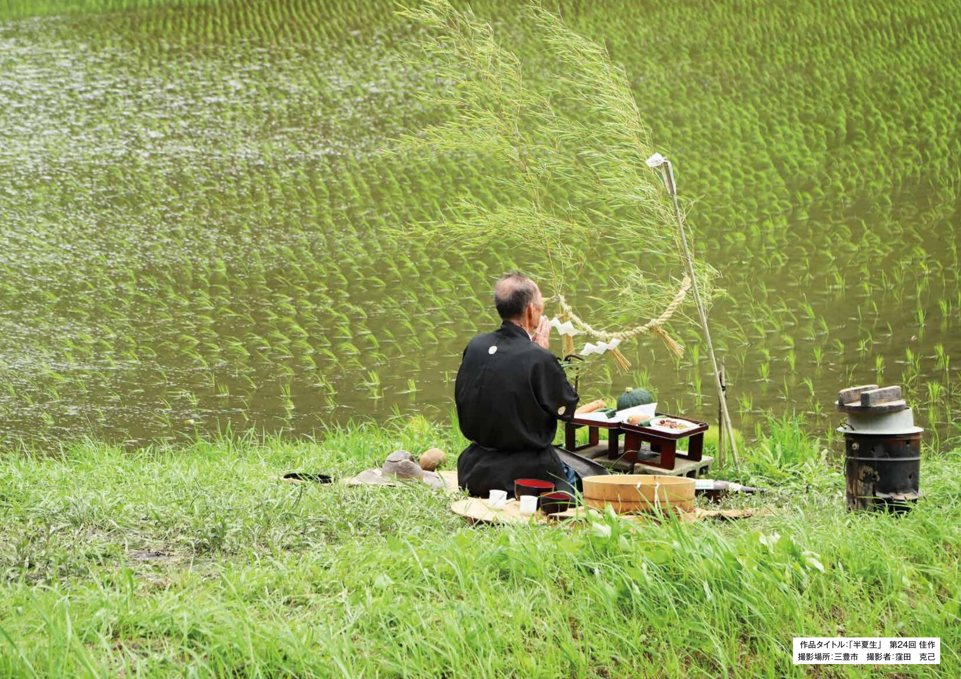
作品タイトル:「半夏生」 第24回 佳作 撮影場所:三豊市