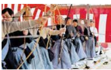
(県指定無形民俗文化財)

ももて祭 厄払いと大漁・豊作、海上安全を祈願して行われるももて祭の弓射儀礼は、無形民俗文化財に指定されている。 (県指定無形民俗文化財)