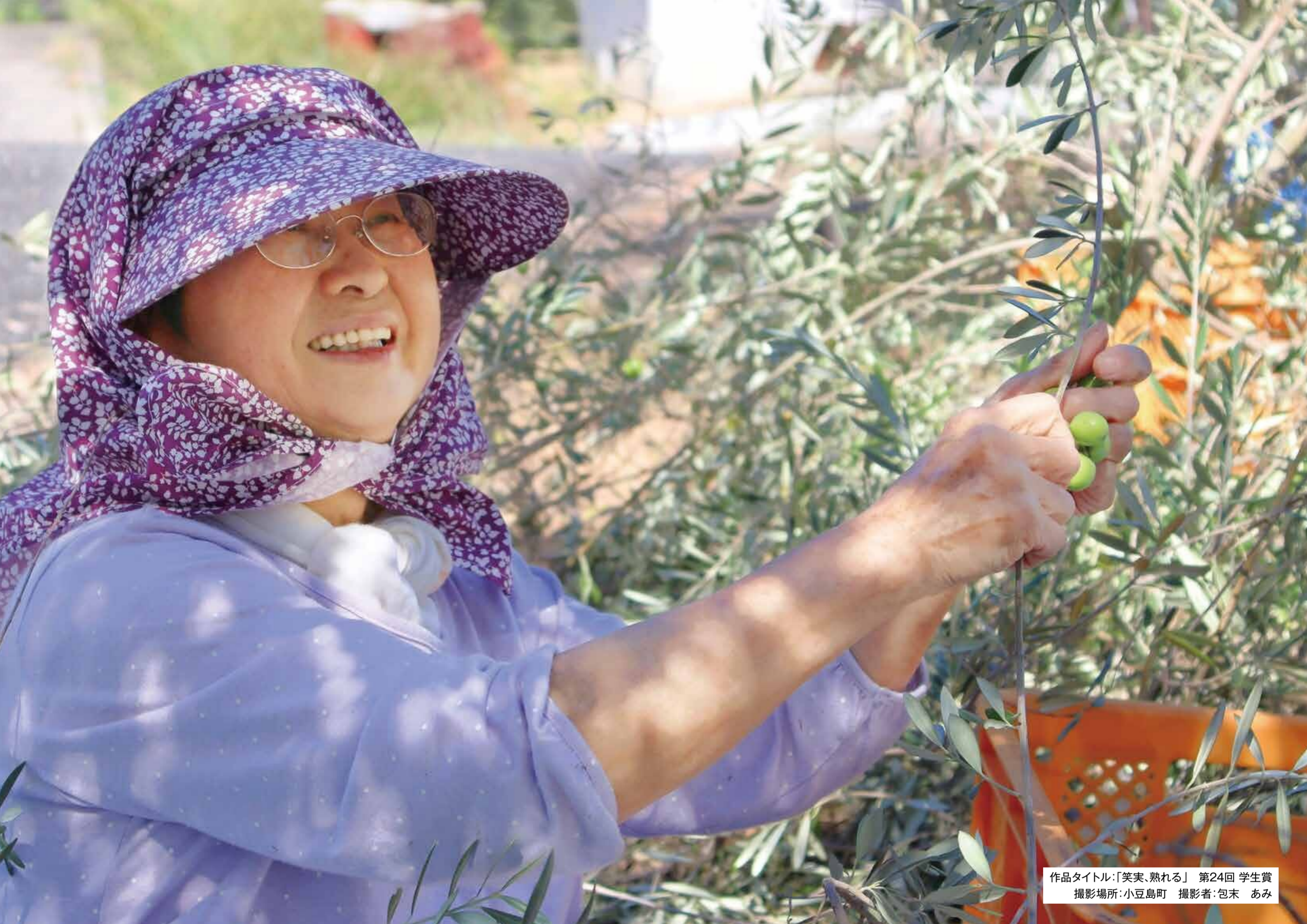
作品タイトル:「笑実、熟れる」 第24回 学生賞 撮影場所:小豆島町