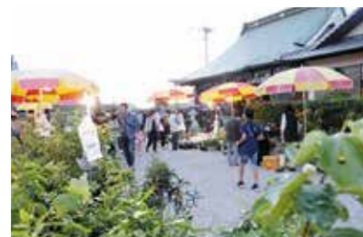
宝円寺春市 (さぬき市長尾東) 6月1日