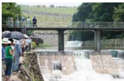
満濃池ゆる抜き (まんのう町神野) 6月15日