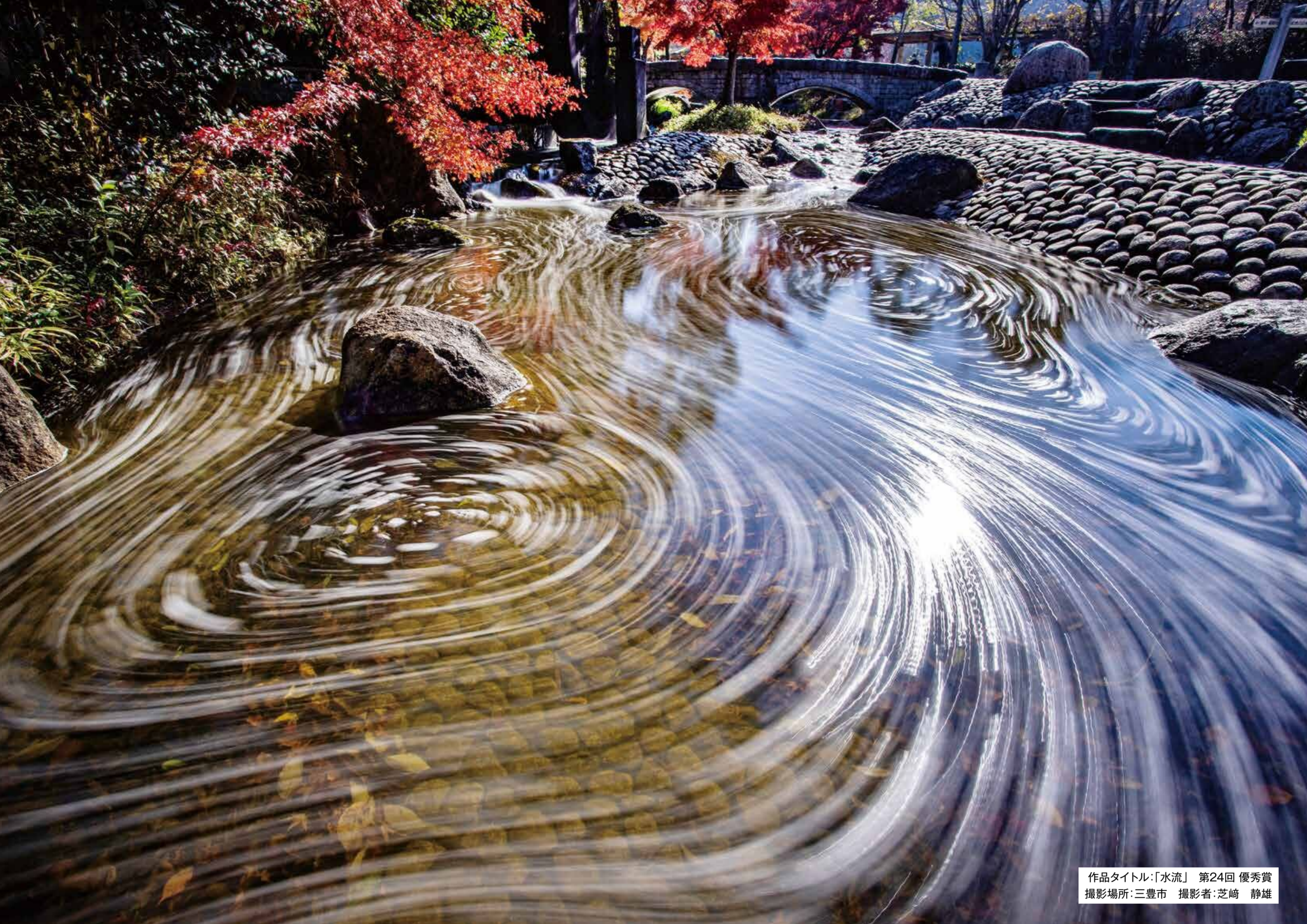
作品タイトル:「水流」 第24回 優秀賞 撮影場所:三豊市