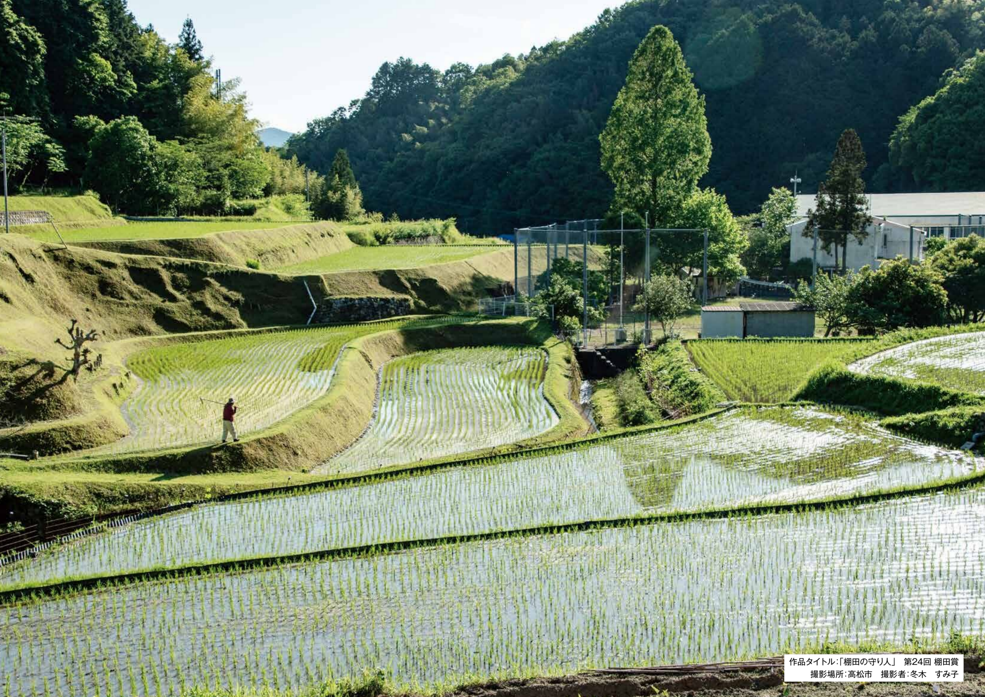
作品タイトル:「棚田の守り人」 第24回 棚田賞 撮影場所:高松市