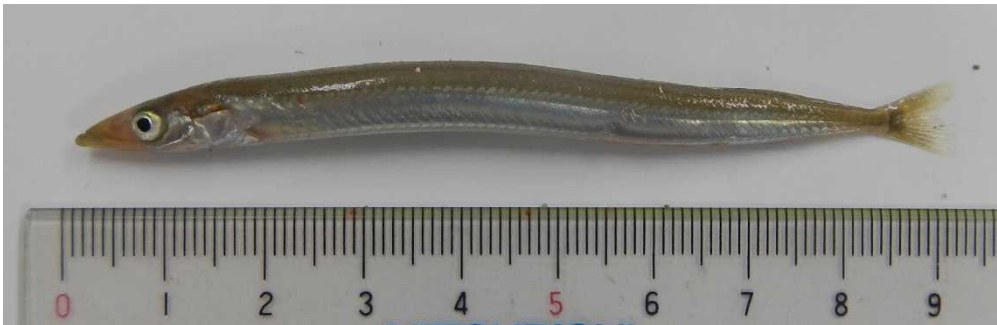
写真1 採集されたイカナゴ (横瀬)

・平均全長は0歳魚が84.9mm (n=16) で、昨年の平均全長80.0mm (n=75) を上回りました (過去10年間の平均全長85.0mm)。