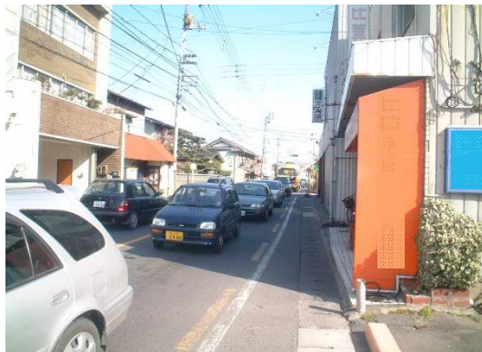
整備前の状況（本線と交差する道路）