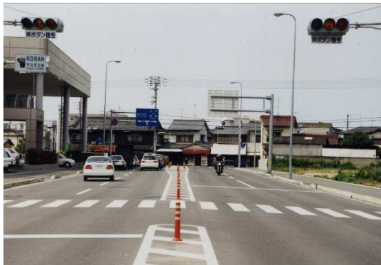
整備前の状況（本線）