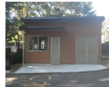
管理棟改修(峰山公園)