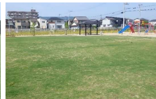
木太えびす公園(H30.3供用)