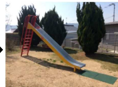
すべり台改修(大町クリーンハイツ公園)