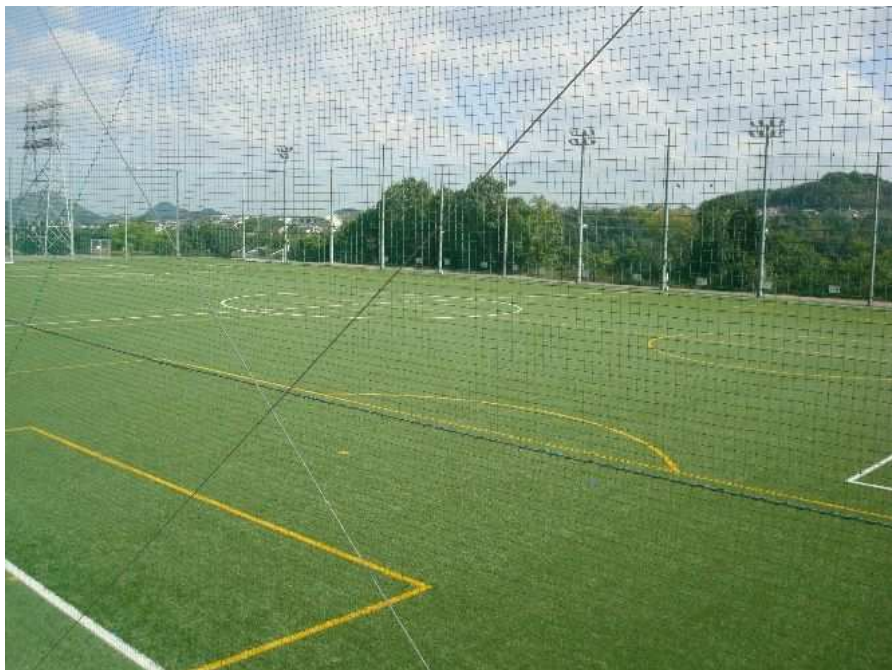
多目的グラウンド(サッカー、ソフトボール、グラウンドゴルフ、ハンドボール、ラグビー等)