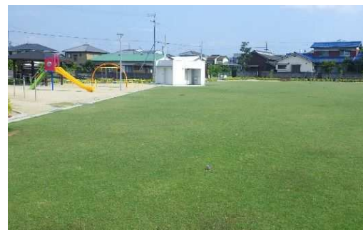
太田南皿井公園(H29.7供用)