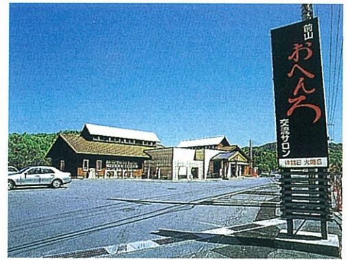
おへんろ交流サロン

さぬき市前山に「おへんろ交流サロン」という施設があります。ここでは、お接待も行われ、お遍路さん同士の心ふれあう情報交換の場となっています。また、遍路文化を知ることのできる「へんろ資料展示室」も併設しています。お接待について施設の方やお遍路さんに聞いてみました。