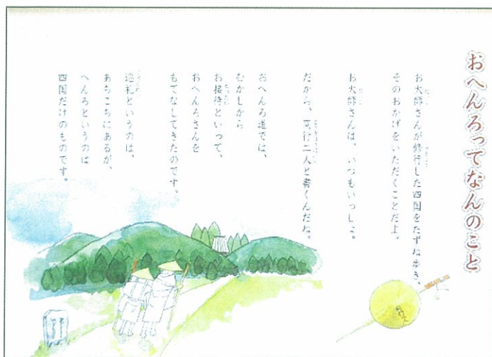
おへんろ交流サロンの説明版より

お接待は、遍路道沿いの家々や道標や常夜灯の側、お寺の境内など様々な場所で行われています。お接待の内容としては、①物品の提供（うどん・お茶・パン等の食べ物や袋・タオル等の日用品）②金銭の提供③行為の提供（道案内・荷物のあずかり・温かい言葉かけ等）④宿泊場所の提供など、いろいろあります。