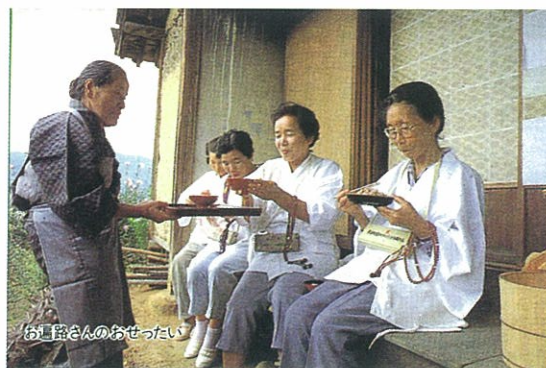
「日本の食生活全集37 聞き書 香川の食事」（農文協刊）より転載 撮影・小倉隆人