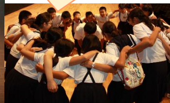
リハーサルの様子