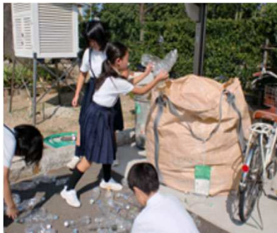
環境委員会によるペットボトルの回収の様子