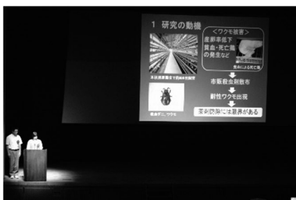
農業・家庭クラブ研究発表