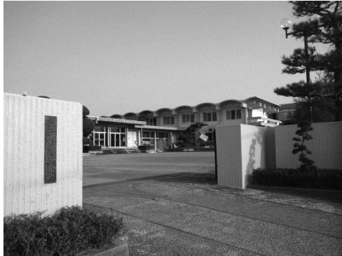
校訓「誠実・明朗・英知」

本校は明治44年に創立され、100年を越える歴史のある伝統校として、地域に根ざした専門高校の実績を誇っています。明朗で純朴な校風のもと、緑豊かな環境、充実した施設設備を生かし、確かな知識と技術を身につけた多くのスペシャリストを輩出しています。また、部活動や農業クラブ活動・家庭クラブ活動も盛んで、生徒は楽しく充実した学校生活を送っています。