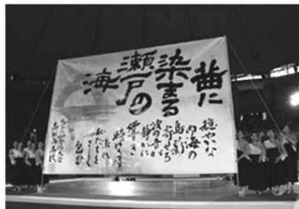
書道部(2019 書道パフォーマンス甲子園 全国大会)

【体育系(16)】野球、卓球、剣道、水泳、陸上競技、サッカー、バレーボール、バドミントン、バスケットボール、ソフトテニス、ハンドボール、テニス、アーチェリー、弓道、応援、ダンス、