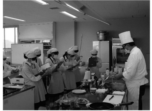
プロ講師による授業

衣、食、保育など生活に必要な知識や技術を身につけ、生活産業や関連する職業を担う職業人の育成をめざします。そのため、2年生からは生徒一人ひとりの進路希望や適性に合うように、3つのコース（服飾デザインコース・健康栄養コース・保育子ども文化コース）を設けています。また3年生では、自らテーマを設定し、実践的・体験的な学習を行ったり、解決策を探究したりする「課題研究」で、さらに専門性を高めます。家庭科技術検定、秘書技能検定、ビジネス文書実務検定、ファッション色彩能力検定、食生活アドバイザー検定等の取得をめざしています。進路状況は、生活産業に関わる大学・短大、専門学校へ進学する生徒が多くなっています。