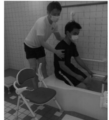
生活支援技術の実習

福祉科は、高齢化の進む現代社会のニーズに応える学科として、平成22年に誕生し、令和5年3月に11回目の卒業生を送り出しました。県内の高校で福祉科を置くのは本校だけです。在学中には、普通教科に加え、「社会福祉基礎」や「生活支援技術」などの専門科目の学習や、特別養護老人ホームなどでの「介護実習」を通して福祉マインドを育み、卒業時に「介護福祉士国家試験」の受験資格を取得できます。直近7年間の介護福祉士合格率は100%です。介護福祉士の資格をベースに、更に新たなスキルを身につけるべく進学する生徒、学んだことを活かすべく県内の福祉施設に就職する生徒など、それぞれが各分野で活躍しています。