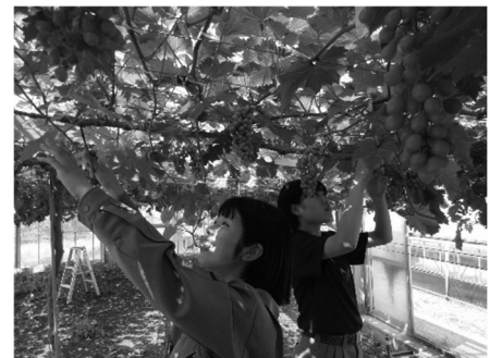
ブドウ栽培の実習風景

環境科学科では、環境に配慮した農作物の栽培と生産物の活用及び地域環境の創造・保全について学習します。2年生からは生徒一人ひとりの興味や関心、進路希望等に応じて、「都市園芸コース」（自然環境との調和を図った都市型施設園芸に関する知識・技術の習得）と「環境土木コース」（自然環境と調和した地域環境の設計や創造に必要な知識・技術の習得）の2つのコースに分かれます。このほか危険物取扱者、測量士補、トレース技能検定等の検定や資格の取得をめざしています。