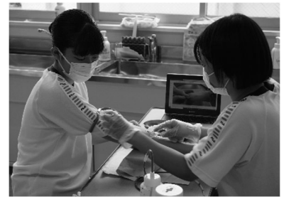
校内実習【採血の練習】