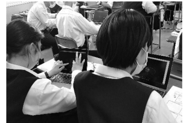
タブレット端末を活用した主体的な学習

普通科では生徒一人ひとりの興味・関心や適性、多様な進路希望等に対応できるような学級編制を行っています。下記のように国公立大学への進学希望者対象の特進クラス（2年生以降は文理コース）を1年生から設け、さらに、2年生からは私立大学・専門学校への進学希望者を対象とした総合コースや情報ビジネスコースも設けています。情報ビジネスコースでは、簿記や情報処理などの各種検定や資格の取得をめざし、進学だけではなく就職に対応した指導もしています。さらに、夏休みには希望者対象の集中学習会や課外、小論文・面接対策等の個別指導も行ない、進路実現を図っています。